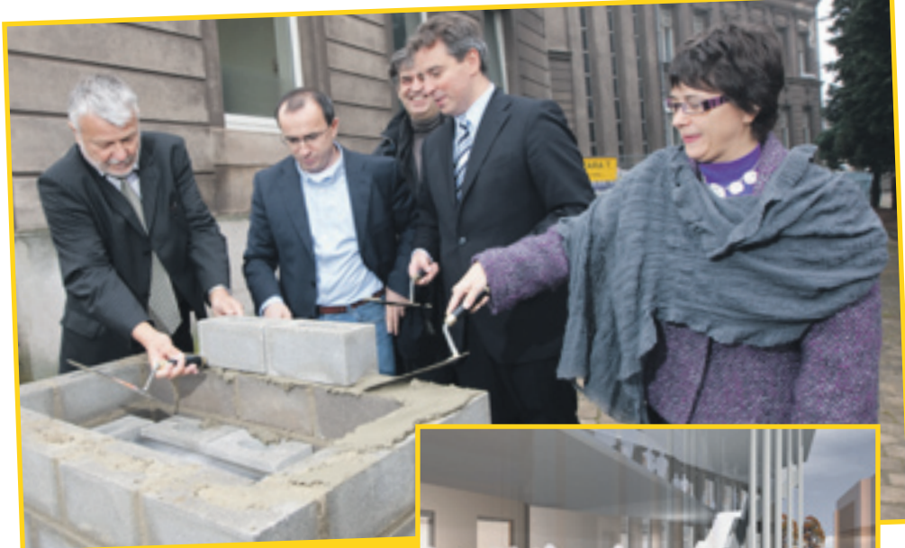
29/10 POSE DE LA PREMIÈRE PIERRE DE L'ANCIEN HÔTEL DE VILLE

Theaterstéck «Den Oscar» Theatersall Uerwerkuer, rue Jean Gallion 20h00 Déifferdenger Theater Reservatioun vun 12h00-14h00 um 50 00 38