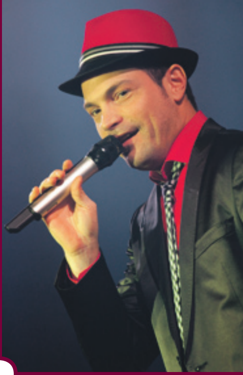
12/11 ROGER CICERO AU CENTRE SPORTIF D'OVERKORN