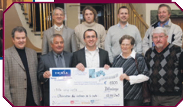
12/11 REMISE D'UN CHÈQUE DE LA PART DES ÉTUDIANTS DE LA MIAMI UNIVERSITY AUX AMIS DE L'ÉCOLE DE MUSIQUE