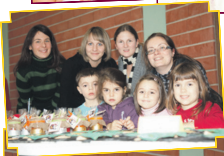
26/11 MARCHÉ DE NOËL À L'ÉCOLE WOIWER