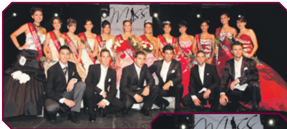
21/11 ELECTION DE MISS PORTUGAL AU CENTRE SPORTIF D'OVERKORN