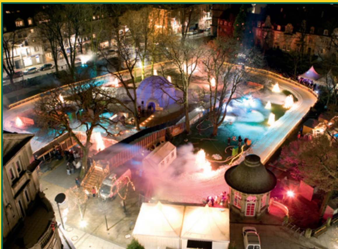
SPORTS D'HIVER AU PARC GERLACHE