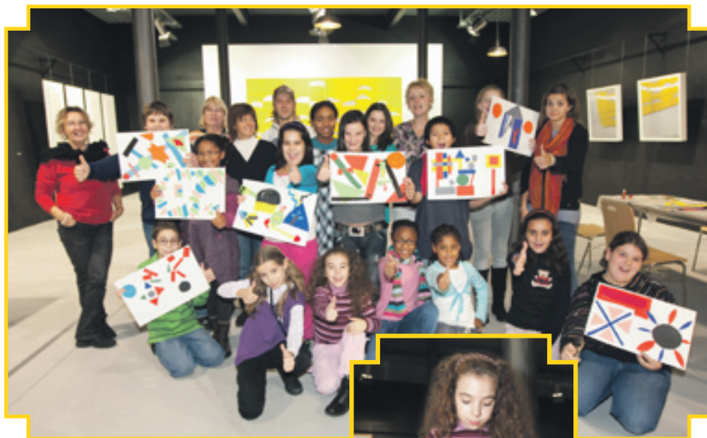
17/11 WORKSHOP H 2 O

Poarverband Déifferdeng Messe de minuit de la communauté portugaise Eglise Fousbann 23h30 Bureau paroissial Differdange