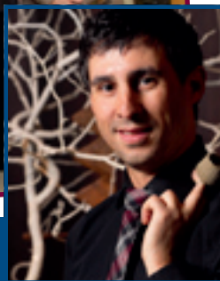
20/3: PRÉSENTATION DU LIVRE ET DU DVD POUR LE 125 E ANNIVERSAIRE DE L'HMD À LA SALLE DE MUSIQUE DE DIFFERDANGE