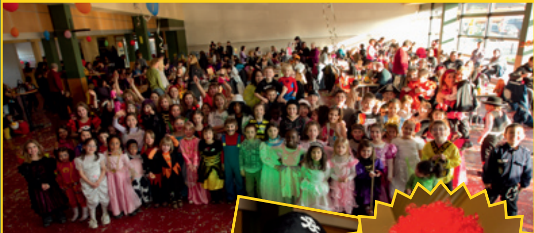
3/3: MINI HEXEBAL AU HALL LA CHIERS

Etangs Clemency Toute la journée Sportfëschchen Nidderkuer