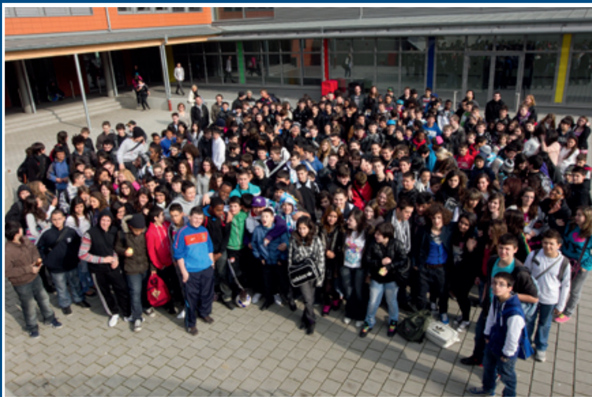
LES ÉLÈVES DE L'ANNEXE «JENKER» DU LTMA

Soirée du bénévolat: Unerkennung un all déi Fräiwëlleg