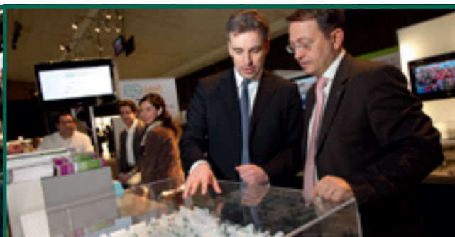
11/3: FOIRE IMMOBILIÈRE LOCALE «URBAN LIVING» AU CENTRE SPORTIF À OBERKORN