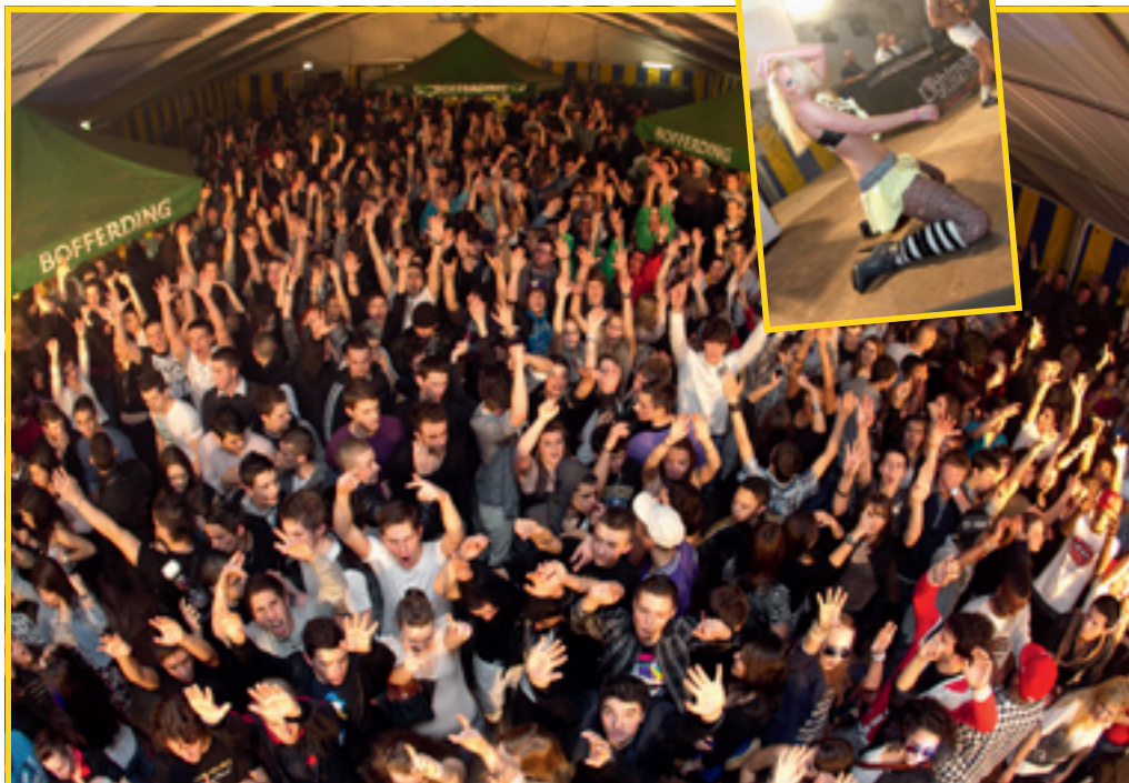
26/2: FÊTE CARNAVALESQUE «ABSEITS» À NIEDERKORN

Theater «Eierens am Néierens» Lasauvage – Salle des fêtes 20h00 Déifferdenger Guiden a Scouten et Amicale «De Maulkuerf» Reservatioun um 26 58 15 49 oder www.lgsd.lu