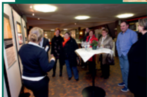
1/3: VISITE GUIDÉE DE L'EXPO UNA GOTA DE MI VIDA CENTRE NOPPENY