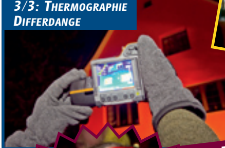
3/3: THERMOGRAPHIE DIFFERDANGE