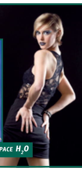
6/3: 2ND LUXEMBOURG STROBIST WORKSHOP A L'ESPACE H 2 O