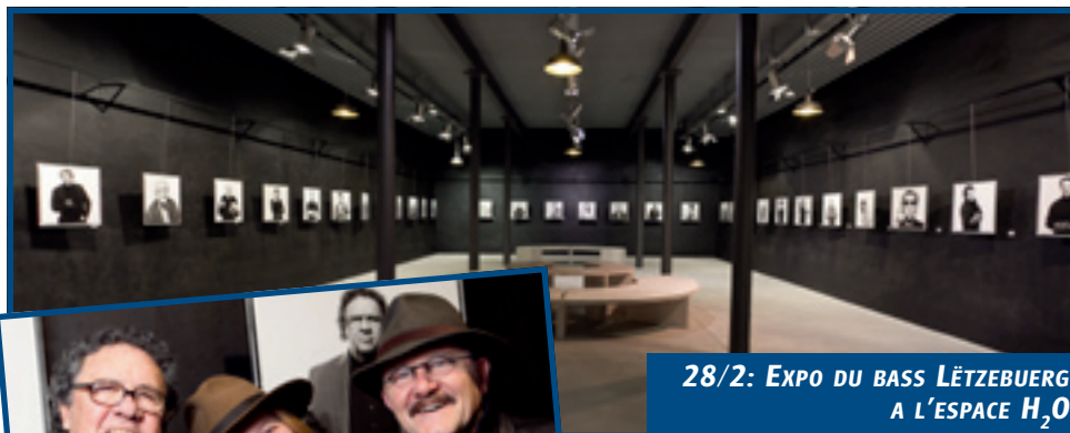
28/2: EXPO DU BASS LËTZEBOURG A L'ESPACE H 2 O