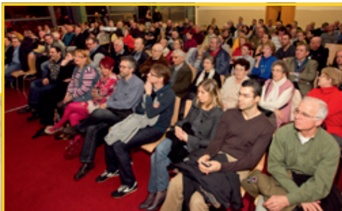
8/3: PRÉSENTATION PUBLIQUE DU PROJET «PLACE DES ALLIÉS» AU HALL LA CHIERS