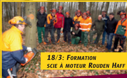
18/3: FORMATION SCIE À MOTEUR ROUDEN HAFF