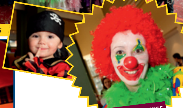
4/3: FUESPARTY SUR LA PLACE DU MARCHÉ À DIFFERDANGE