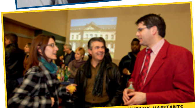
1/3: POT DE BIENVENUE POUR LES NOUVEAUX HABITANTS AU HALL LA CHIERS