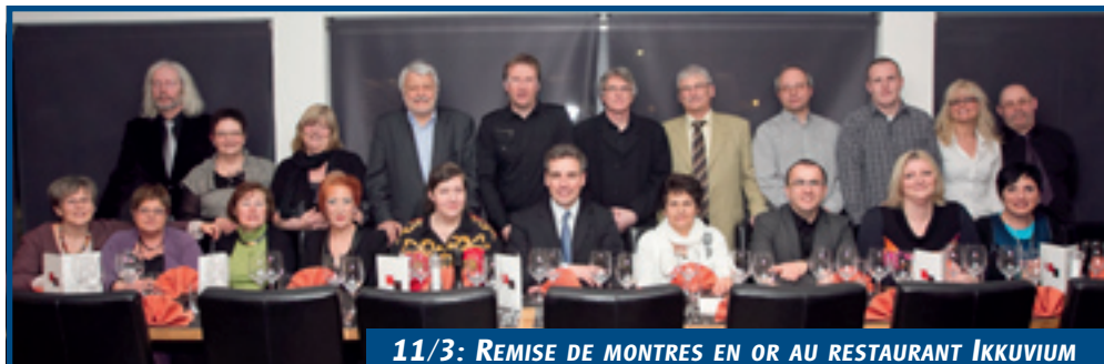
11/3: REMISE DE MONTRES EN OR AU RESTAURANT IKKUVIUM