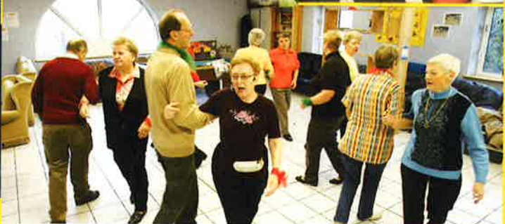
Activités seniors 2006