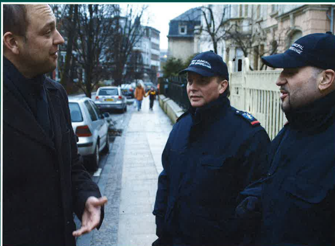
LES AGENTS MUNICIPAUX EN CONVERSATION AVEC LA POPULATION

Als es in Differdingen zwei Schlösser gab