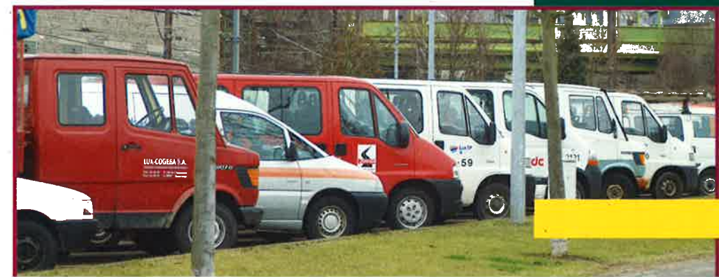
LE PARKING DU CONTOURNEMENT

Snack Yildiz 22, avenue de la Liberté L-4601 Differdange Tél. 26 58 33 01