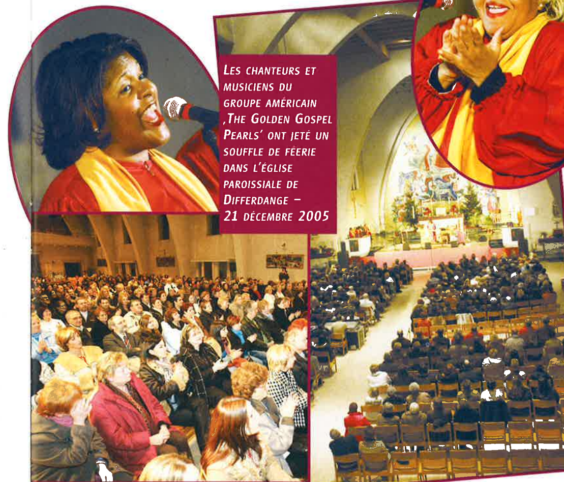
LES CHANTEURS ET MUSICIENS DU GROUPE AMÉRICAIN 'THE GOLDEN GOSPEL PEARLS' ONT JETÉ UN SOUFFLE DE FÉERIE DANS L'ÉGLISE PAROISSIALE DE DIFFERDANGE – 21 DÉCEMBRE 2005