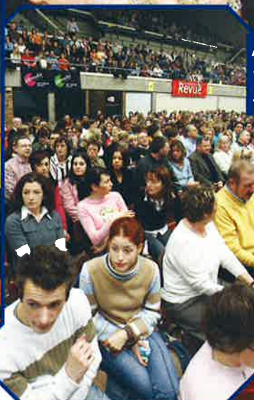
ABBA MANIA GREATEST HITS - CENTRE SPORTIF - 22 JANVIER