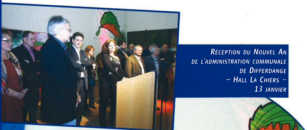
RÉCEPTION DU NOUVEL AN DE L'ADMINISTRATION COMMUNALE DE DIFFERDANGE - HALL LA CHIERS - 13 JANVIER