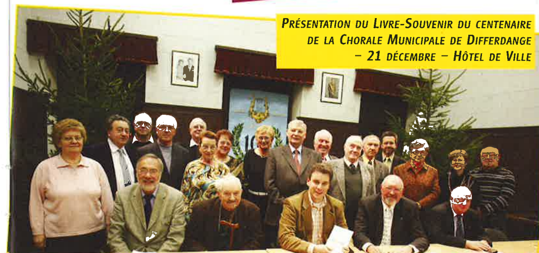
PRÉSENTATION DU LIVRE-SOUVENIR DU CENTENAIRE DE LA CHORALE MUNICIPALE DE DIFFERDANGE – 21 DÉCEMBRE – HÔTEL DE VILLE