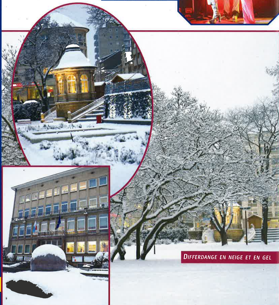
DIFFERDANGE EN NEIGE ET EN GEL