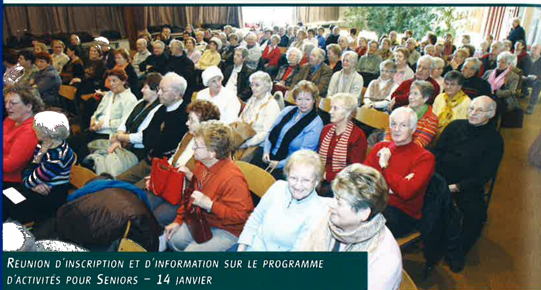
REUNION D'INSCRIPTION ET D'INFORMATION SUR LE PROGRAMME D'ACTIVITÉS POUR SENIORS - 14 JANVIER