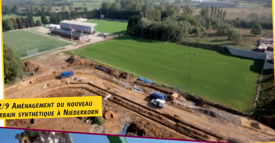
22/9 AMÉNAGEMENT DU NOUVEAU TERRAIN SYNTHÉTIQUE À NIEDERKORN