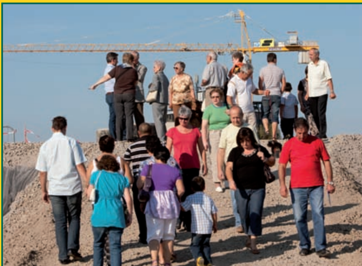
PORTES OUVERTES ARBORIA: LA POPULATION DÉCOUVRE L'AMBITIEUX PROJET DU PLATEAU DU FUNICULAIRE