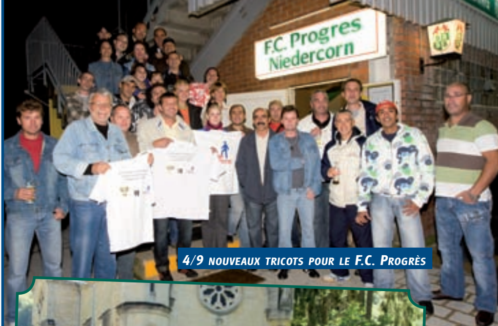
4/9 NOUVEAUX TRICOTS POUR LE F.C. PROGRÈS

Grousse Bichermoart Hall polyvalent «La Chiers» à Differdange 10 octobre: 14h00-18h00 11 octobre: 11h00-18h00 Liesen zu Déifferdeng a Collaboratioun mat der Bibliothéik