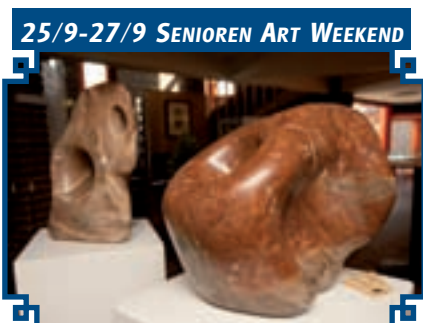
25/9-27/9 SENIOREN ART WEEKEND