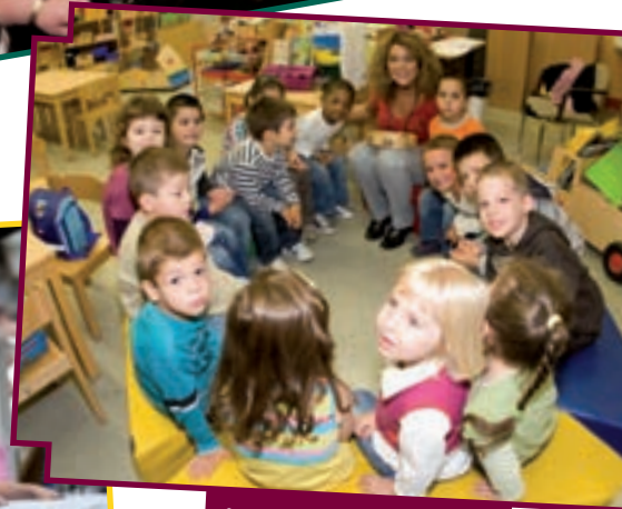
15/9 RENTRÉE SCOLAIRE POUR LA JEUNESSE DE DIFFERDANGE