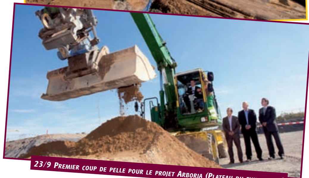
23/9 PREMIER COUP DE PELLE POUR LE PROJET ARBORIA (PLATEAU DU FUNICULAIRE)