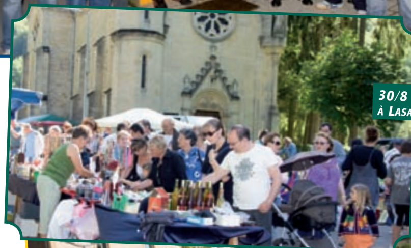
30/8 EUROBRUCANTE À LASAUVAGE