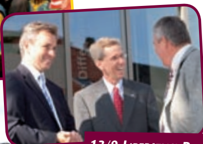
13/9 LIBERATION DAY