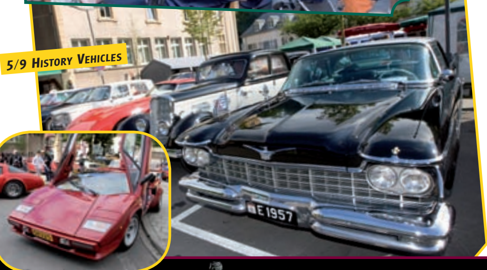
5/9 HISTORY VEHICLES