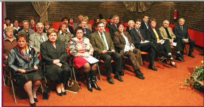
75 e ANNIVERSAIRE DU FOYER DE LA FEMME DIFFERDANGE - CENTRE NOPPENY - 27 NOVEMBRE

Kuerderbal Café "Beim Spidol" à Niederkorn 20h30. Lidderfrënn