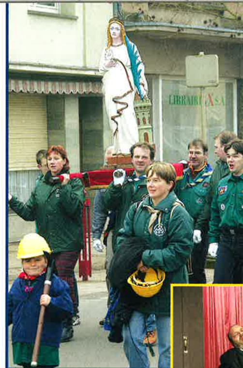
FÊTE SAINTE-BARBE - 4 DÉCEMBRE