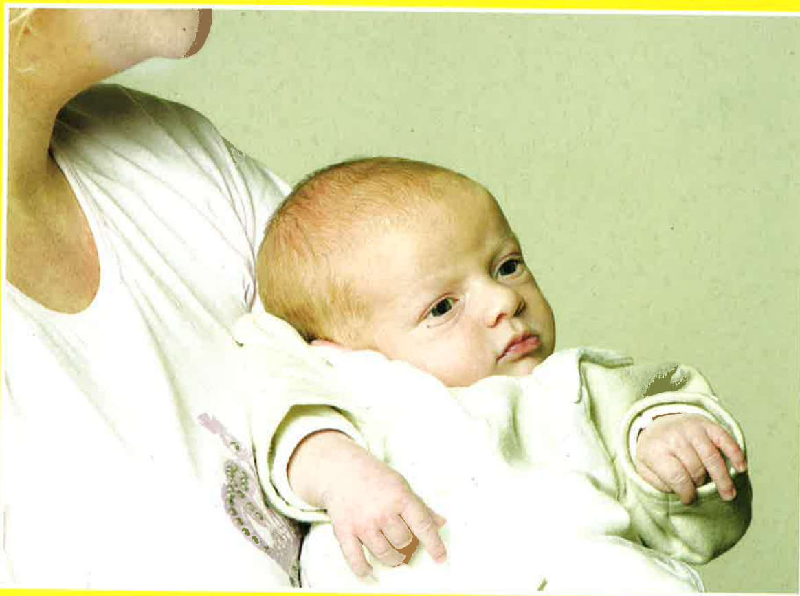
LENA: LE 20.000 e HABITANT DE DIFFERDANGE