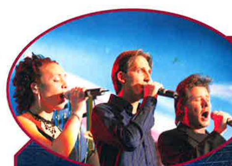
LET'S TALK ABOUT MUSIC: SHOW BIG BAND OPUS 78 - HALL SPORTIF OBERKORN - 4 DÉCEMBRE