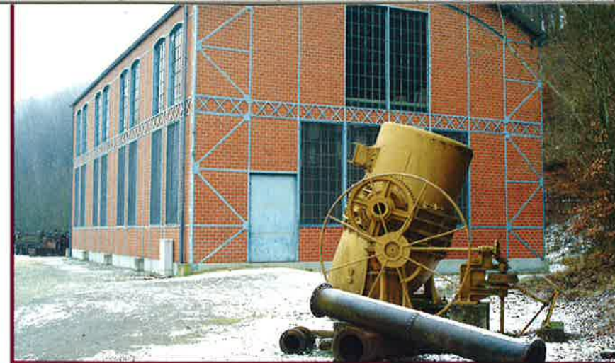
LE HALL PAUL WURTH EST INSTALLÉ AU FOND-DE-GRAS DEPUIS 1988

En 1923, la fonderie et l'aciérie de l'Union des Acières furent reprises par la Société Anonyme des Anciens Etablissements Paul Wurth. En 1928, un contrat fut conclu entre l'Arbed et Paul Wurth S.A. en vue de la construction de la ligne aérienne électrique reliant Arbed Dommeldange et Paul Wurth. En 1930, un transformateur de 6500/5000 volts fut installé sur le terrain de Paul Wurth à côté de la centrale électrique avec raccordement au réseau triphasé. La même année, un groupe convertisseur fut installé dans la centrale électrique en vue de la transformation du courant électrique triphasé de 5000 volts en courant continu de 250 volts. Ce groupe convertisseur comprenait un moteur synchrone construit par la firme «Constructions