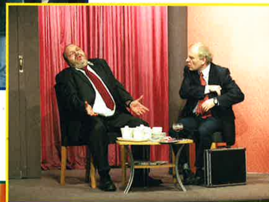
THÉÂTRE: 'WA SCHON, DA SCHON!' PAR LE DÉIFFERDANGER THEATER