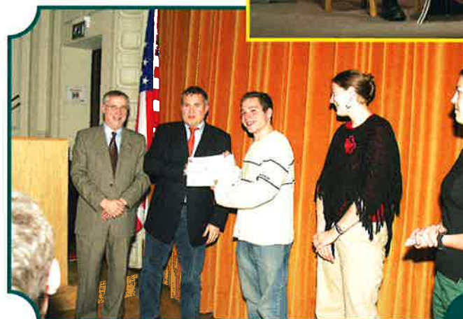
REMISE D'UN CHÈQUE PAR LES ÉTUDIANTS DE LA MIAMI UNIVERSITY EN FAVEUR DES ENFANTS NÉCESSITEUX DE LA COMMUNE - 25 NOVEMBRE