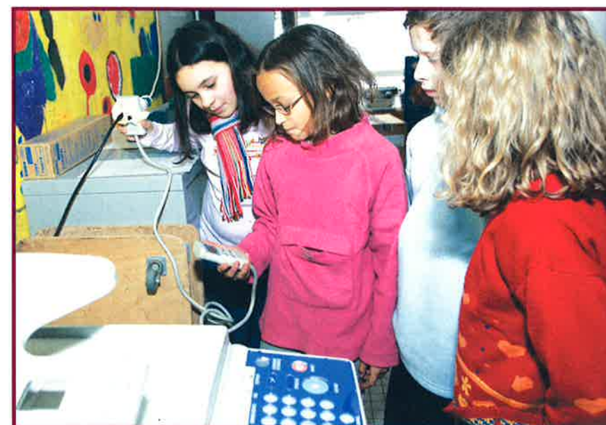
MESSUNG DES ELEKTRIZITÄTSVERBRAUCHS DES FOTOKOPIERERS IM STAND-BY-MODUS

Im Gegensatz zu den Nikolaustüten des vergangenen Jahres waren diejenigen, die in diesem Jahr zur Verteilung gekommen sind, weitaus weniger kommerziell ausgerichtet. So wurden hauptsächlich Transfair-Produkte gekauft, die auch zum Anlass genommen werden sollen, die Kinder und die Familien auf die Pro-