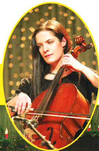
RENTNERFEIER - CENTRE SPORTIF OBERKORN - 16 DÉCEMBRE