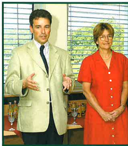
MME MINISTRE ANNE BRASSEUR ET LE BOURGMESTRE CLAUDE MEISCH LORS DE L'OUVERTURE DU BUREAU

Faisant suite à une nouvelle législation votée en 2002, le premier bureau régional de l'inspection a été inauguré à Differdange en juin dernier, en présence de Mme Anne Brasseur, ministre de l'Éducation nationale, de la Formation professionnelle et des Sports.