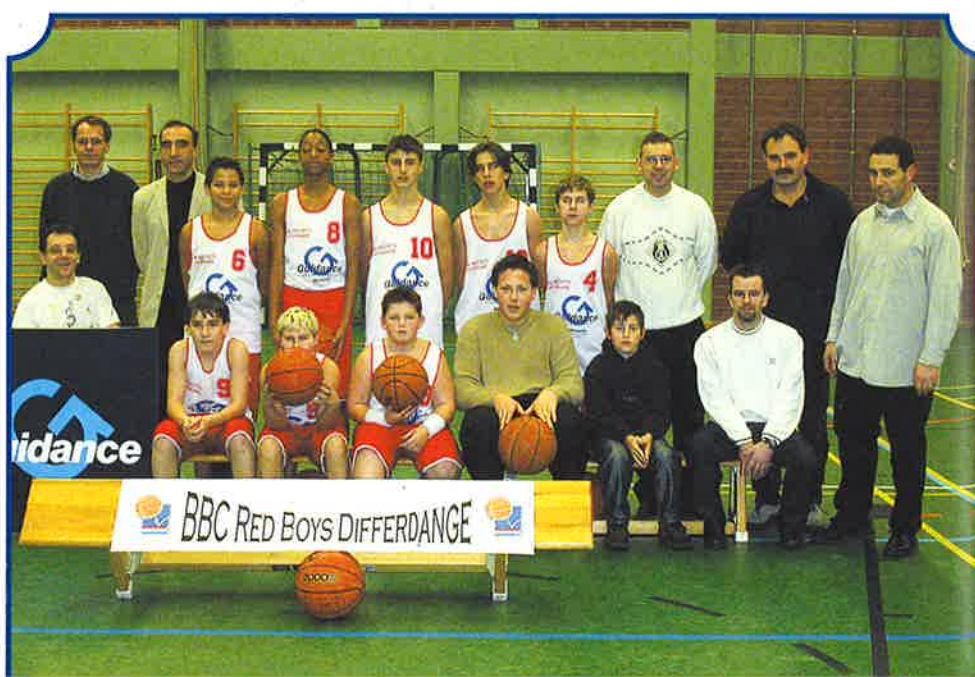
L'ÉQUIPE SCOLAIRES 2002/2003

Wenn Sie über Teletext verfügen, können Sie die gewünschte Information direkt anpeilen.