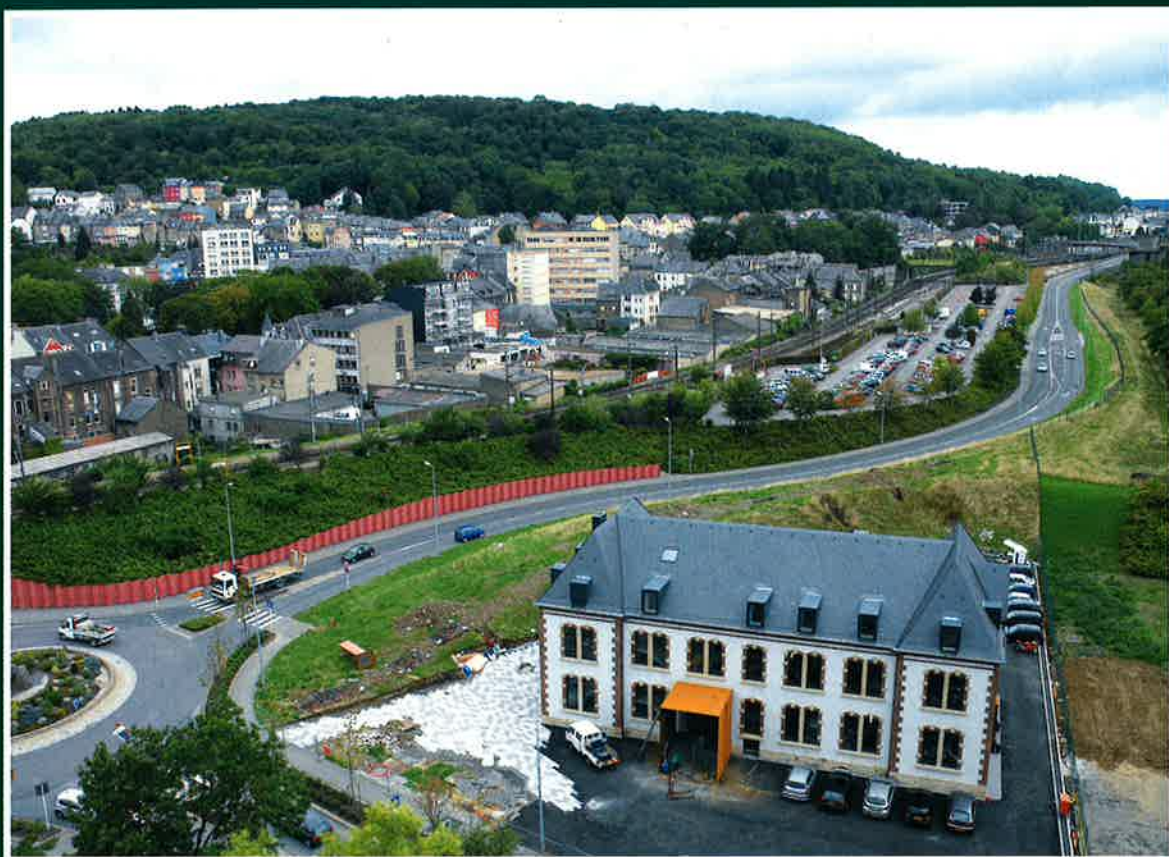
LA VILLA HADIR: ANCIENNE BÂTISSE HISTORIQUE RESTAURÉE ACCUEILLANT PLUSIEURS SOCIÉTÉS DE COMMUNICATION

Autofreies Wochenende vom 22. bis 24. September