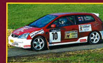
SIMON-THEIN, RALLYE-CHAMPIONS 2005

Am kommenden 29. und 30. September wird es zu einer Neuauflage der „Rallye de Luxembourg“ kommen, die in Zusammenarbeit des Rallye Supporter Club Luxembourg mit dem ADAC Saarland, dem ATC Merzig und der MOMA (Motorsport Marketing) organisiert wird. Die Rallye wird für die Luxemburger Rallye Meisterschaft, die Saarländische Rallye Meisterschaft sowie die „Euro Rallye Trophée“ gewertet werden. Neu im Boot wird die „Écurie Tételberg“ sein. Auf Betreiben des Vereins werden zwei Wertungsprüfungen (19,4 Kilometer) auf einem Gelände zwischen Differdingen, Péttingen und der französischen Grenze bestritten. Der Startschuss fällt freitags, den 29. September 2006 gegen 19 Uhr . Die Zufahrt ist beschildert ab der „rue de Hussigny“ in Differdingen und der „rue de Longwy“ in Niederkorn. Der Fuhrpark wird beim „Rouden Haff“ zu bestaunen sein, wo die Zufahrt jedoch über Rodingen erfolgen muss. Für das leibliche Wohl werden die lokalen Vereine sorgen.