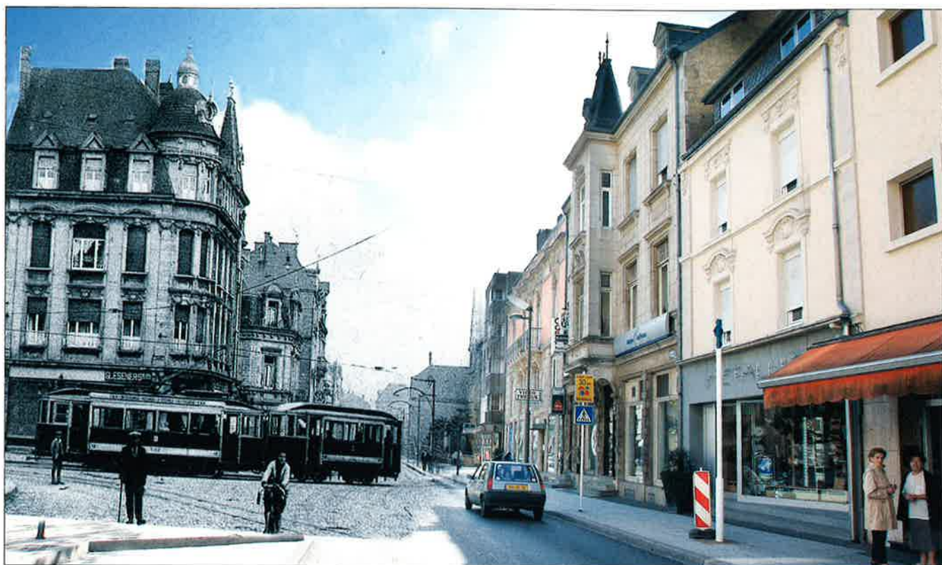
COIN RUE EMILE MARK / AVENUE DE LA LIBERTÉ