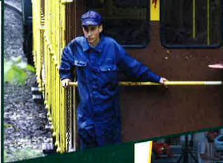
LE TRAIN 1900 ET LA MINIÈRESBUNN: GRANDES ATTRACTIONS DE L'ÉTÉ