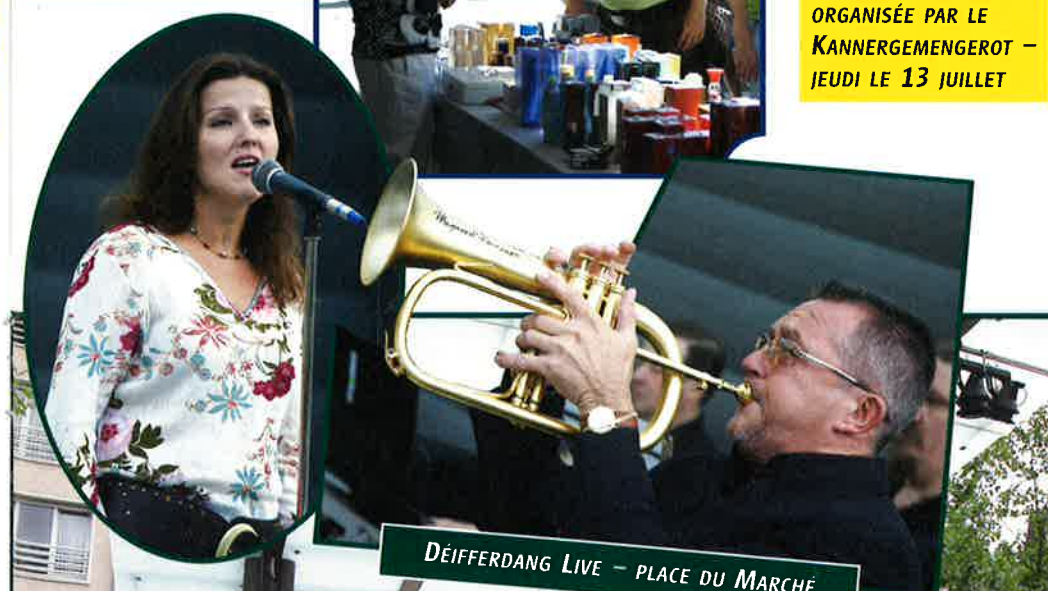
SORTIE DANS LA PISCINE EN PLEIN AIR ORGANISÉE PAR LE KANNGEMENGEROT – JEUDI LE 13 JUILLET