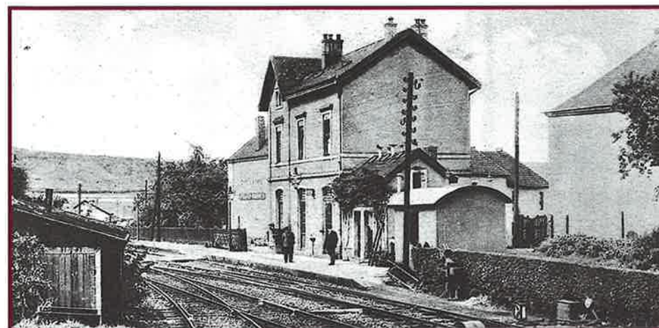
DER FRÜHERE OBERKORNER BAHNHOF

Hier im Süden war eine belgische Gesellschaft bereit, in den Bau einer Eisenbahnlinie zu investieren, die hauptsächlich dem Abtransport des Eisenerzes dienen sollte. So entstand nach vielen Traktationen und Problemen die „Société des Chemins de Fer et Minières Prince Henri“, diesmal zu Ehren des Prinzen Heinrich, des jüngeren Bruders des König-Großherzogs. Der König hatte ihn zum