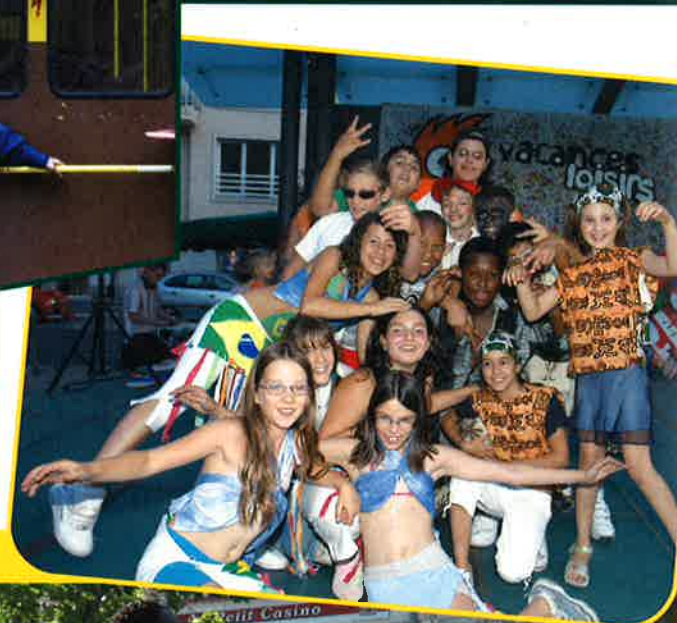
VACANCES LOISIRS 2006