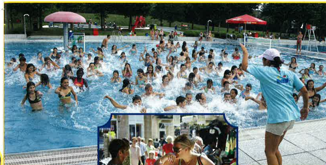
BRADERIE DU 15 JUILLET