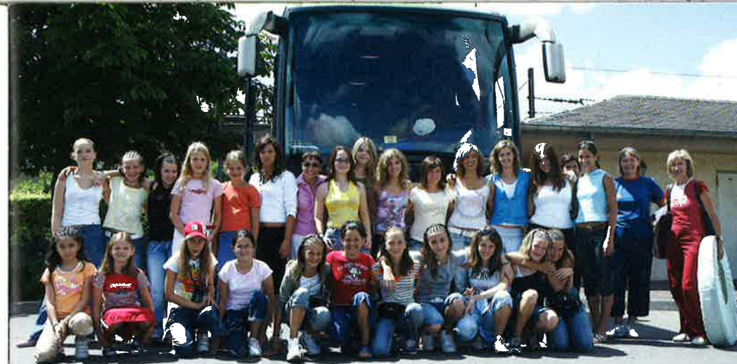
PARTICIPATION DU CLUB GRS DIFFERDANGE AU GRAND FESTIVAL DE GYMNASTIQUE EUROGYM 2006 À GAND DU 8 AU 14 JUILLET