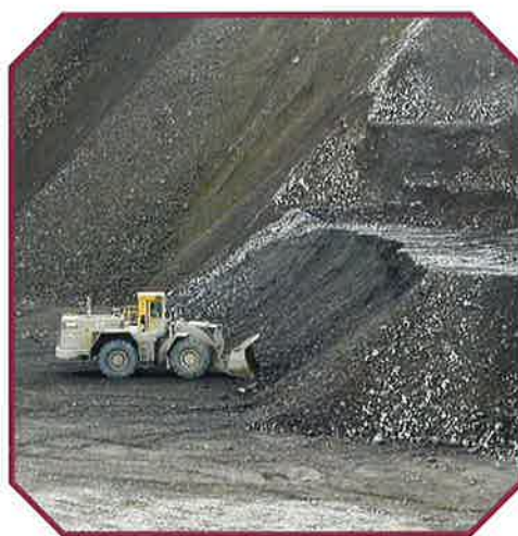
DANS LA ZONE 'GADDERSCHEIER' À DIFFERDANGE, DE GROS ENGINS DE CHANTIER, TYPE CATERPILLAR D10R, DISLOQUENT LE CRASSIER EN BLOCS

Die Preisüberreichung an die Gewinner des Wettbewerbs 2002 wird am Freitag, dem 7. Februar, um 19 Uhr, im Home St-Joseph in Niederkorn stattfinden.