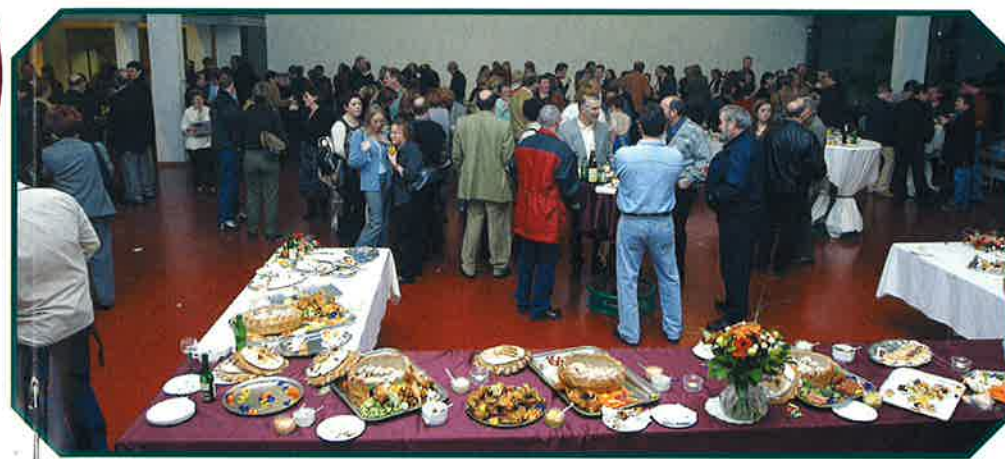
320 MEMBRES DU PERSONNEL COMMUNAL, AINSI QUE DU CORPS ENSEIGNANT ONT PARTICIPÉ À CETTE SOIRÉE