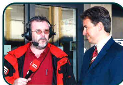
LE BOURGMESTRE CLAUDE MEISCH EN INTERVIEW AVEC RTL PENDANT L'INAUGURATION DU DIFFBUS

Au mois de décembre 2002, certains n'en croyaient pas leurs yeux: des minibus circulaient dans tout Differdange et l'on pouvait y prendre place gratuitement! Ce n'était qu'une expérience test, mais un mois de transport gratuit, quel beau cadeau!