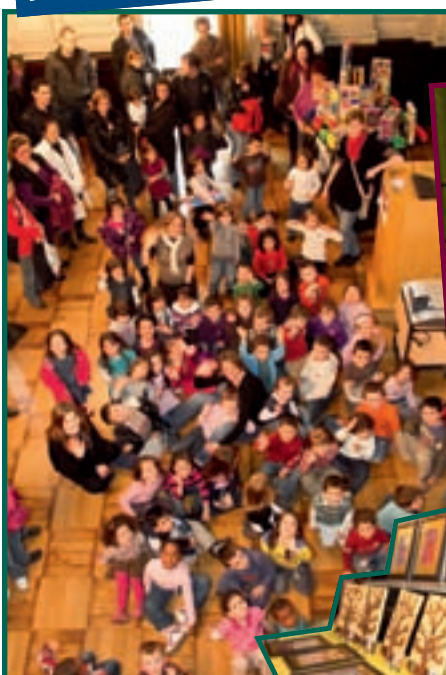
1/4 EXPO ARTISTIQUE À LA MIAMI UNIVERSITY