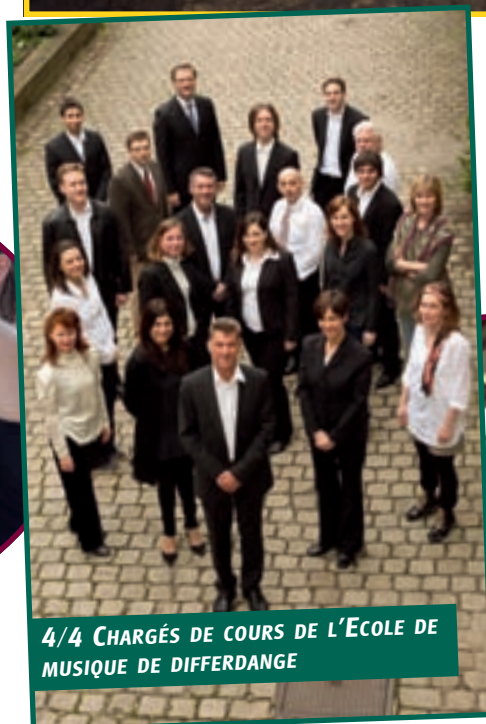
4/4 CHARGÉS DE COURS DE L'ÉCOLE DE MUSIQUE DE DIFFERDANGE