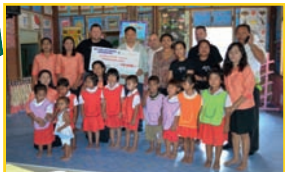
15/4 REMISE D'UN CHÈQUE DE L'ASSOCIATION 'DAO SIAM DÉIFFERDENG' À L'ÉCOLE MATERNELLE 'THUNG SA NGOP' (THAÏLANDE)