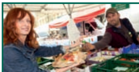
14/4 DISTRIBUTION D'OEUF DE PÂQUES PLACE DU MARCHÉ DIFFERDANGE