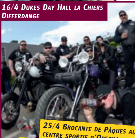
25/4 BROCANTE DE PÂQUES AU CENTRE SPORTIF D'OVERKORN