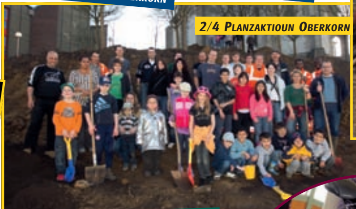
2/4 PLANZAKTIION OBERKORN