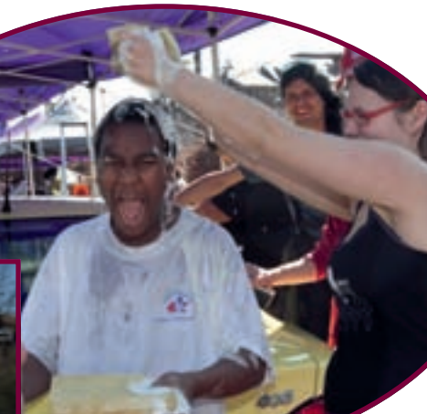
2/4 CAR WASH CONTOURNEMENT DIFFERDANGE