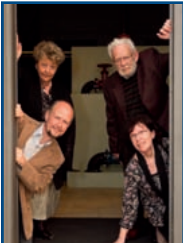
11/4 LUNDI LITTÉRAIRE GROSSE EIFEL KRIMINACHT ESPACE H 2 O