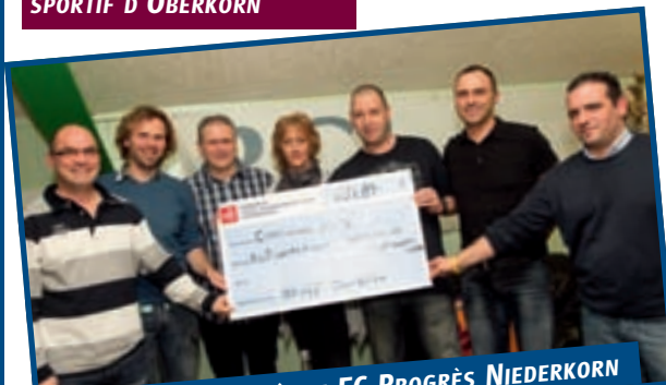
31/3 REMISE DE CHÈQUE FC PROGRÈS NIEDERKORN