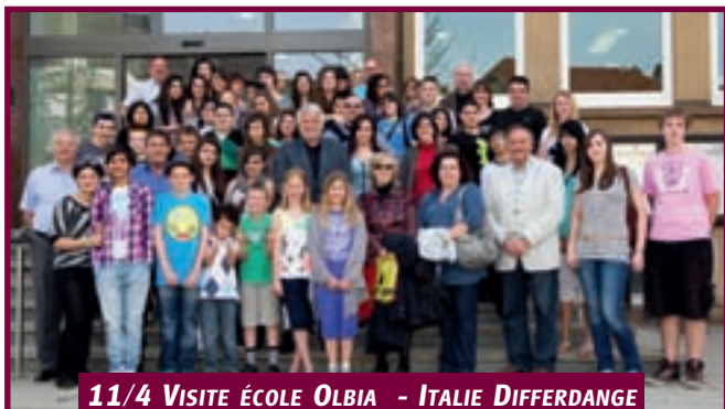
11/4 VISITE ÉCOLE OLBIA - ITALIE DIFFERDANGE