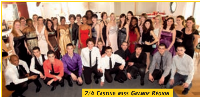
2/4 CASTING MISS GRANDE RÉGION