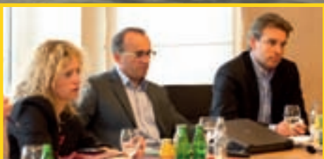
26/4 VISITE COMMISSION DE LA CHAMBRE DES DÉPUTÉS, PRÉSENTATION PROJET BÉBÉ PLUS