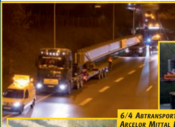
6/4 ABTRANSPORT TRAGER B6N ARCELOR MITTAL DIFFERDINGEN