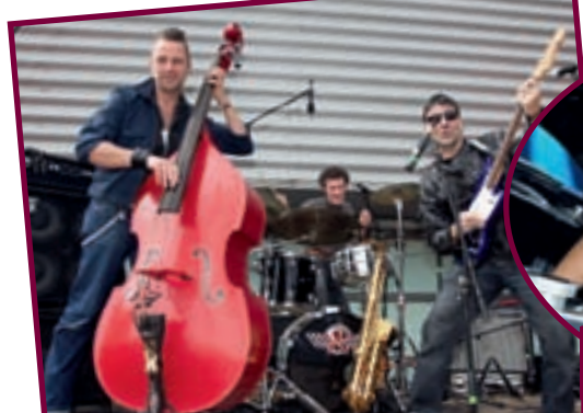
16/4 DUKES DAY HALL LA CHIERS DIFFERDANGE