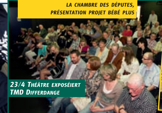
23/4 THÉÂTRE EXPOSÉIERT TMD DIFFERDANGE