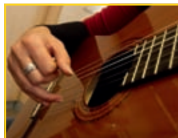
31/3 ÉCOLE DE MUSIQUE À DIFFERDANGE