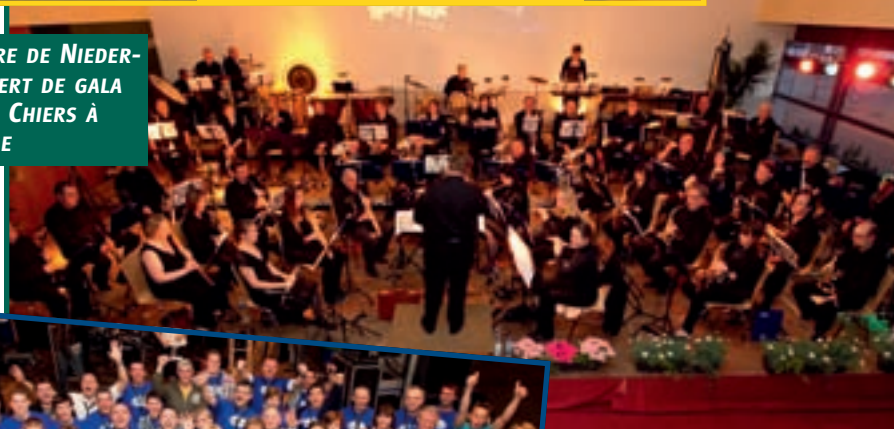
2/4 FANFARE DE NIEDERKORN, CONCERT DE GALA AU HALL LA CHIERS À DIFFERDANGE