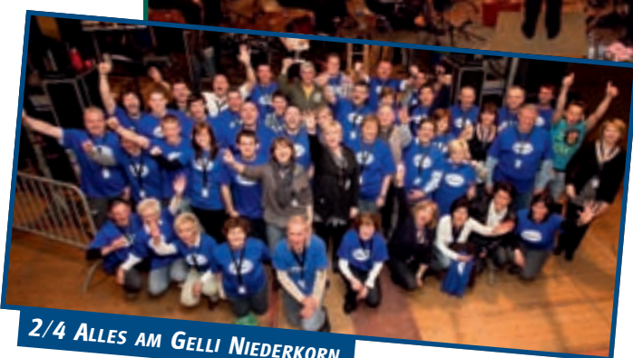
2/4 ALLES AM GELLI NIEDERKORN