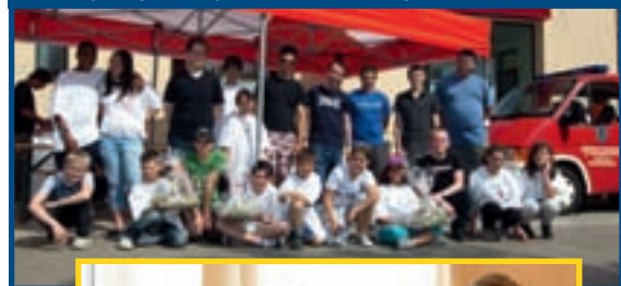
23/4 CROIX-ROUGE, VENTE D'OEUF DE PÂQUES SUR LA PLACE DU MARCHÉ À DIFFERDANGE