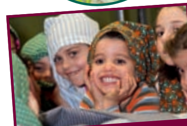
1/4 SOIRÉE TÉLÉVIE AVEC LES MAISONS RELAIS AU CENTRE SPORTIF