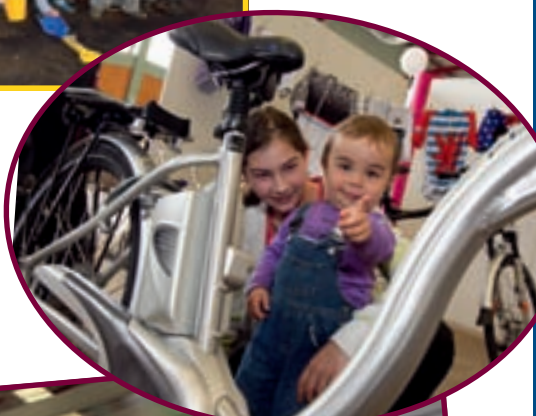
3/4 FESTIVAL DU VÉLO CENTRE SPORTIF NEIWIES