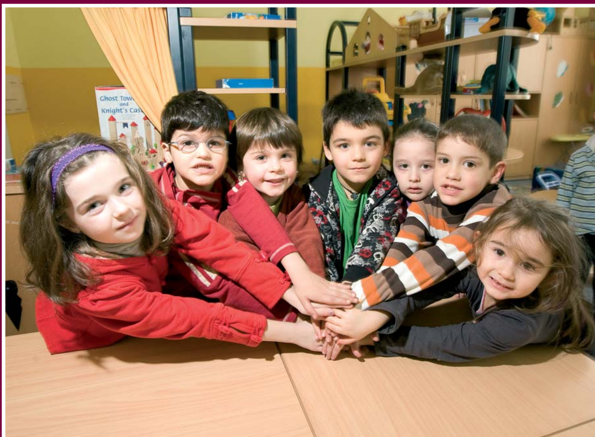
LES ENFANTS ATTENDENT NOËL AVEC IMPATIENCE