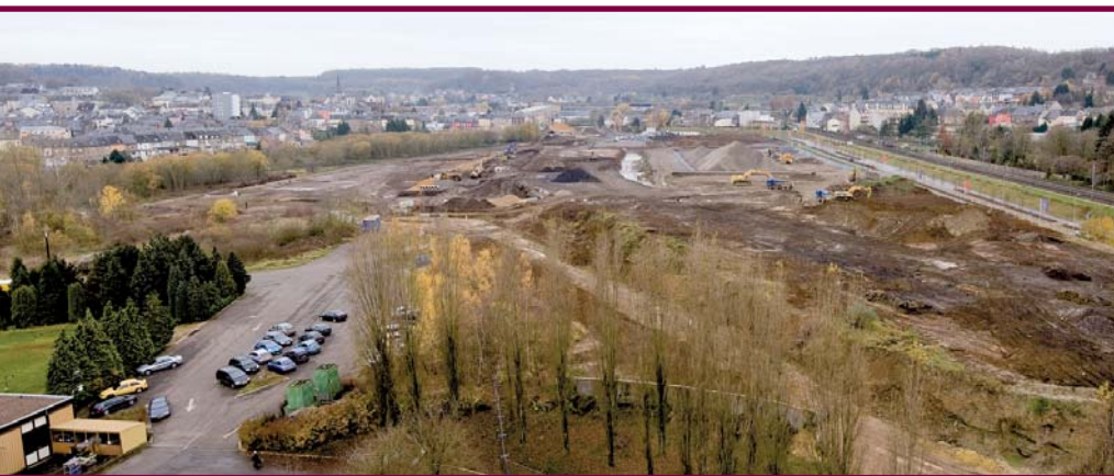
Le vaste projet d'aménagement du plateau du Funiculaire dotera Differdange d'un nouveau quartier proche du centre-ville comme de la nature ainsi que des infrastructures sportives.