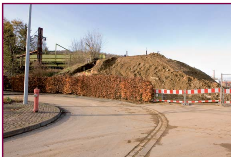
L'extension de la zone d'activité Haneboesch à Niederkorn offrira après sa réalisation de nouvelles perspectives d'implantation aux entreprises.