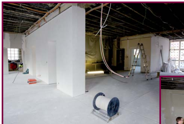
Le nouveau bureau de la population de la mairie: Bientôt plus vaste et mieux aménagé pour un service encore meilleur.

Pas de répit pour les braves! Voilà bien un slogan qui correspond à Differdange. Malgré le nombre considérable de projets déjà réalisés dans la commune dans le but d'y améliorer davantage la qualité de vie, l'administration communale poursuit inlassablement ses efforts. L'avenir de la commune est en jeu, et l'on étudie constamment de nouvelles perspectives. S'il est impossible d'illustrer tous les projets en cours de réalisation (sans oublier les projets qui sont encore à l'étude: le Parc des sports, le carreau du Thilleberg etc.), voici quelques-uns des chantiers en cours actuellement.