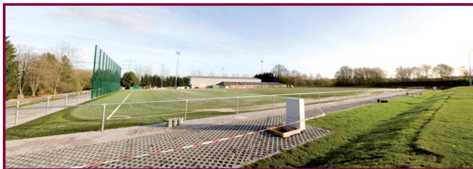
Le terrain de football synthétique à côté du stade Jos Hauptert offrira un cadre idéal pour les manifestations sportives.