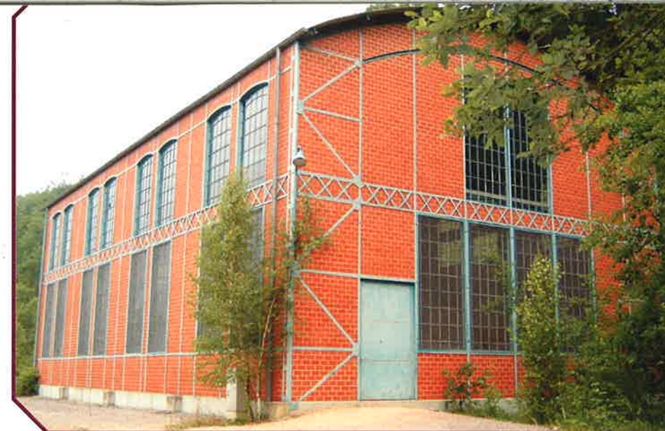
CETTE HALLE INDUSTRIELLE ACCUEILLERA UNE EXPOSITION IMPORTANTE

malgré tous les obstacles qu'elles peuvent rencontrer, elles nous font découvrir le monde à travers des images fascinantes. Cette exposition est un hommage aux femmes qui ont sillonné le monde dès le début du 20 e siècle pour le compte de la National Geographic Society. L'exposition qui compte environ 80 photos de 30 photographes, américaines pour la plupart, retrace les débuts historiques du journalisme photographique, relate des reportages aventureux et nous montre des portraits intimes de situations contemporaines. On y retrouve des images colorées à la main de Eliza Scidmores et des reportages d'Ella Maillart et de Dickey Chapelle qui furent tuées lors d'un reportage-photo au Vietnam du Sud en 1965. Les portraits discrets de Karen Kasmauki sont particulièrement impressionnants et Alexandra