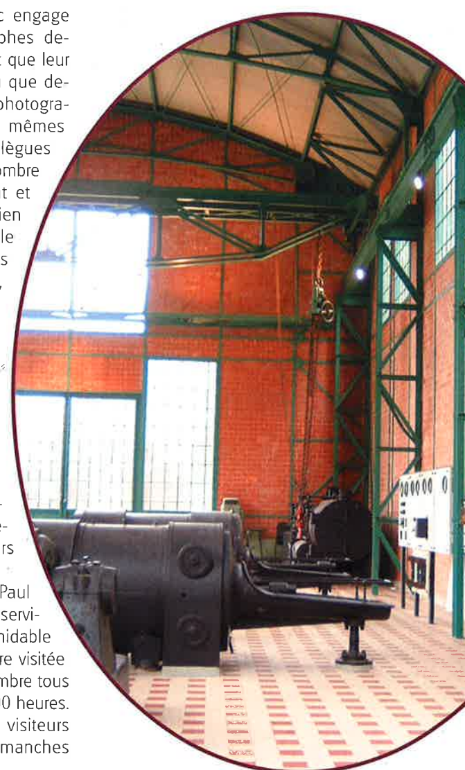
L'INTERIEUR DE LA HALLE PAUL WÜRTH

des attractions du parc industriel et ferroviaire du Fond-de-Gras et se promener à bord du Train 1900 ou de la Minièresbunn et découvrir les sentiers thématiques du Prénzeberg et du Giele Botter tout proches ainsi que le site archéologique du Tételberg.