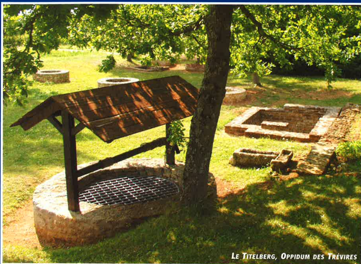
LE TITELBERG, OPPIDUM DES TRÉVIRES

Les femmes photographes du National Geographic: Exposition