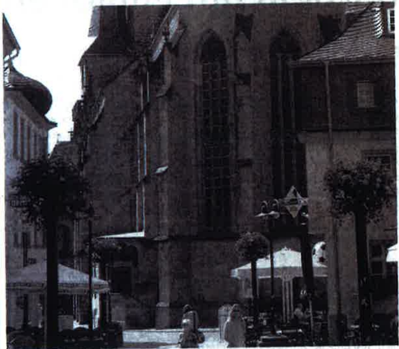
Rund um den Dom wird gezaubert, was das Zeug hält

Das saarländische Städtchen ist an diesem zur Bühne für Zauberer aus aller Welt