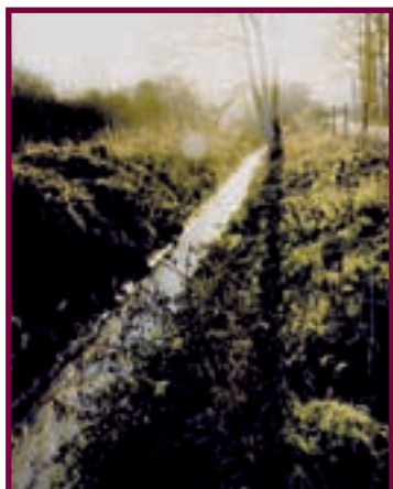
SAUBERES WASSER DANK TRENNUNGSSYSTEM UNTER DEM „PARC DE LA CHIERS“

zur Expansion und eine Vielzahl an neuen Arbeitsplätzen wird geschaffen.