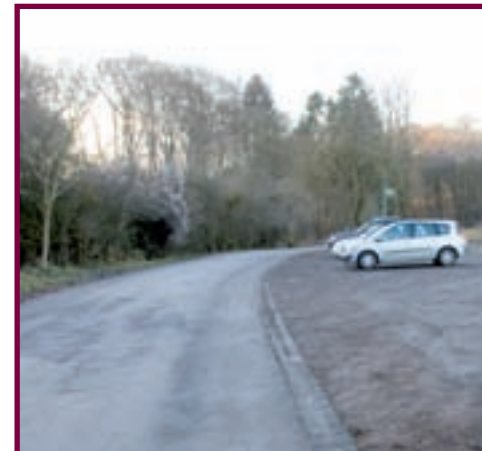
BESSERE BEDINGUNGEN FÜR AUTOFAHRER WIRD NACH SEINER INSTANDSETZUNG BIETEN

der „rue Alexandre“ und der „rue des Jardins“ aus Zugang zum Radweg „Thillebiere“ haben werden.