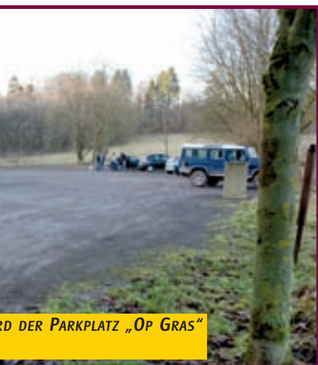
RD DER PARKPLATZ „OP GRAS“

Bei diesen Projekten handelt es sich um die wichtigsten Pläne, welche die Gemeinde im Jahr 2009 in die Tat umsetzen wird. Nahezu das gesamte Spektrum