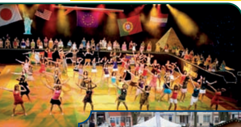
13 DÉCEMBRE, GALA FLIC FLAC AU CENTRE SPORTIF D'OVERKORN