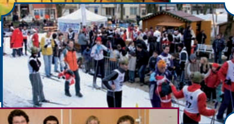
14 DÉCEMBRE, LE PROMI-LAF 2008 A ATTIRÉ SPECTATEURS ET CÉLÉBRITÉS AU PARC GERLACHE