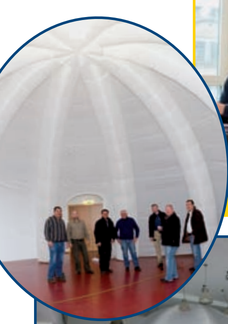
2 DÉCEMBRE, CONFÉRENCE DE PRESSE «BILAN DU CENTENAIRE»