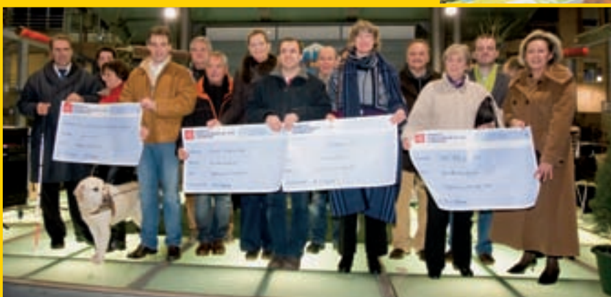
21 DÉCEMBRE, «DÉIFFERDENG, ENG STAD HËLLEFT» SOUTIENT LES ASSOCIATIONS HUMANITAIRES AU MARCHÉ DE NOËL