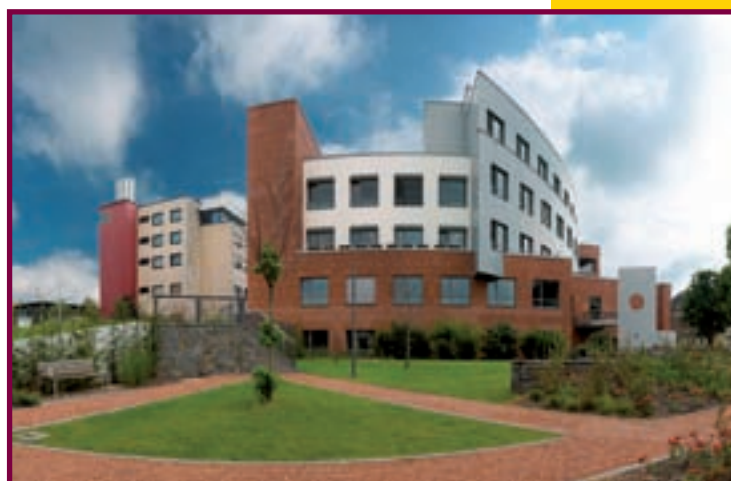
LE CENTRE HOSPITALIER EMILE MAYRISCH À ESCH-SUR-ALZETTE

En tout état de cause, tous nos efforts visent à couvrir au mieux les besoins sanitaires actuels et à assurer une mission de santé publique tout en réalisant une plus-value en efficience qualitative et économique dans le cadre d'une prise en charge globale des patients.