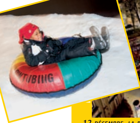
12 DÉCEMBRE, LA PISTE DE SKI EST OUVERTE AU PUBLIC: SENSATIONS ASSURÉES