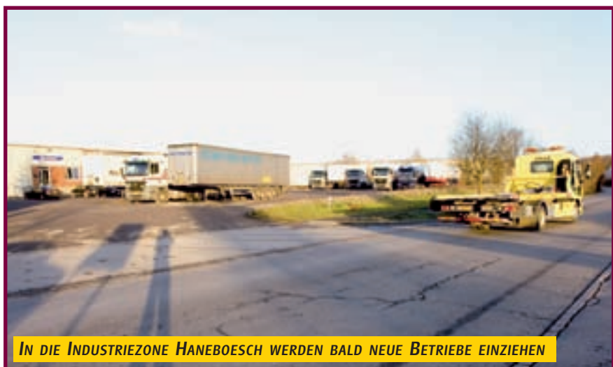
IN DIE INDUSTRIEZONE HANEBOESCH WERDEN BALD NEUE BETRIEBE EINZIEHEN

Vergrößert wird auch die Industriezone „Haneboesch“, die sich künftig noch besser für gemeindeinterne Aktivitäten anbieten wird. Auch wird die Erweiterung dazu beitragen, dass sich neue Betriebe in Differdingen niederlassen und die Wirtschaft ankurbelt wird. Bereits ansässige Betriebe erhalten die Möglichkeit