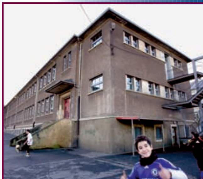
DIE FOUSBANNER SCHULE WIRD RENOVIERT UND VERGRÖßERT

an sozialen, pädagogischen, kulturellen, umweltfreundlichen und sportlichen Themen ist abgedeckt und spricht für den frischen Wind, der in unserer Stadt weht. Die Gemeinde Differdingen ist für ihre Bürger da, denn sie sind es, die aus der Stadt das machen, was sie ist: ein aufregendes Fleckchen Erde, das exotische Kulturen mit luxemburgischer Tradition, alte Architektur mit modernsten Standards und tatsächliche Erkenntnisse mit innovativen Ideen koppelt. Demnach kann im neuen Jahr kaum etwas schiefgehen.