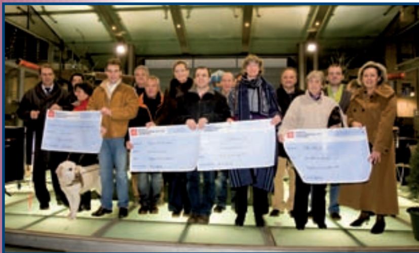
LA REMISE OFFICIELLE DES CHÈQUES A EU LIEU SUR LE KIOSQUE DE LA PLACE DU MARCHÉ LE 21 DÉCEMBRE 2008

Chaque année, la Ville de Differdange, en collaboration avec plusieurs associations locales ainsi qu'avec les commissions et services communaux, essaie de recueillir des moyens financiers à reverser à des œuvres de bienfaisance. Ainsi, le dimanche 21 décembre 2008, quatre chèques d'une valeur totale de 10.000 euros ont pu être remis à des associations nationales et internationales.