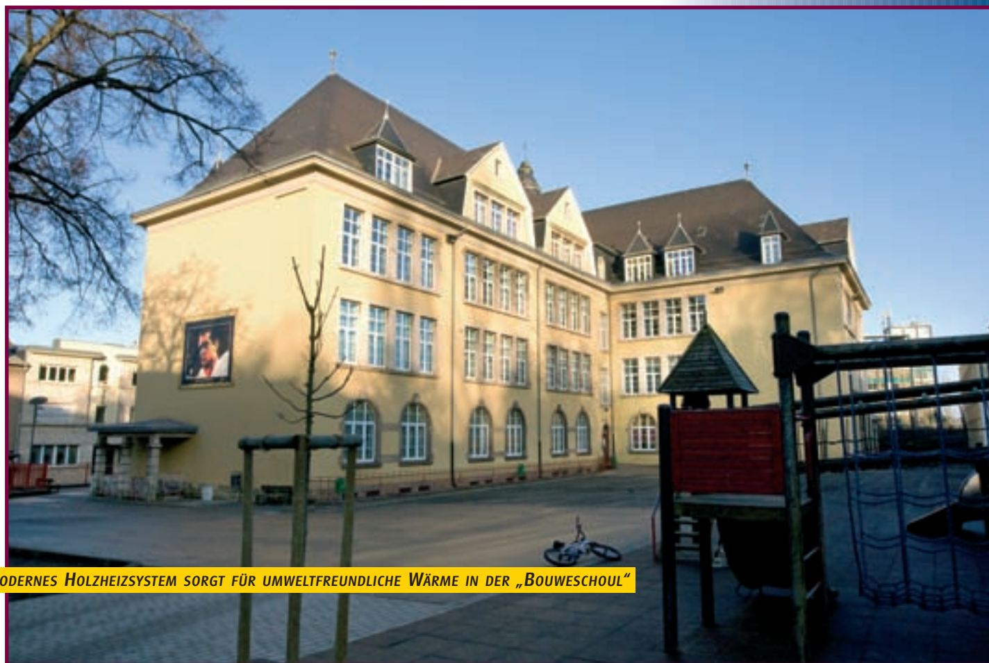
EIN MODERNES HOLZHEIZSYSTEM SORGT FÜR UMWELTFREUNDLICHE WÄRME IN DER „BOUWESCHOOL“