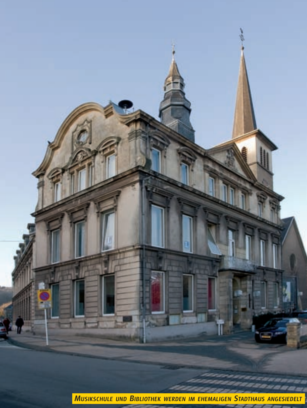
MUSIKSCHULE UND BIBLIOTHEK WERDEN IM EHEMALIGEN STADTHAUS ANGESIEDELT