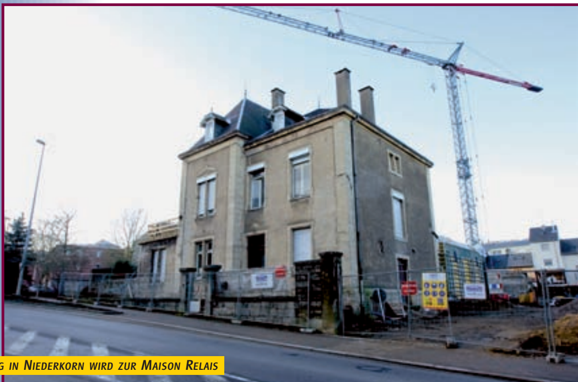
DIE MAISON ERPELDING IN NIEDERKORN WIRD ZUR MAISON RELAIS

Nach mehr als hundert Jahren Stadtgeschichte hat Differdingen das Streben noch lange nicht verlernt. Ein Jahr voller Trubel und Innovationen liegt hinter uns. Wir haben unserer Vergangenheit bedacht und die Gegenwart gefeiert. Viel Neues hat dazu beigetragen, unsere Stadt attraktiver zu machen, und ihren Status als eine der wichtigsten Anlaufstellen des Landes zu festigen. Dass wir auch 2009 in keinen Dornröschenschlaf fallen werden, liegt auf der Hand. Das Jahresbudget steht fest, und bereits jetzt befinden sich viele interessante Projekte in den Startlöchern.