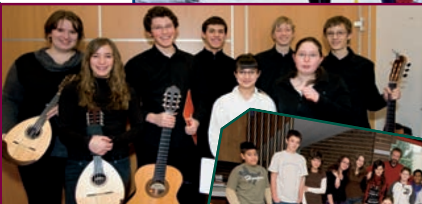
16 DÉCEMBRE, AUDITION DE L'ÉCOLE DE MUSIQUE AU HALL LA CHIERS