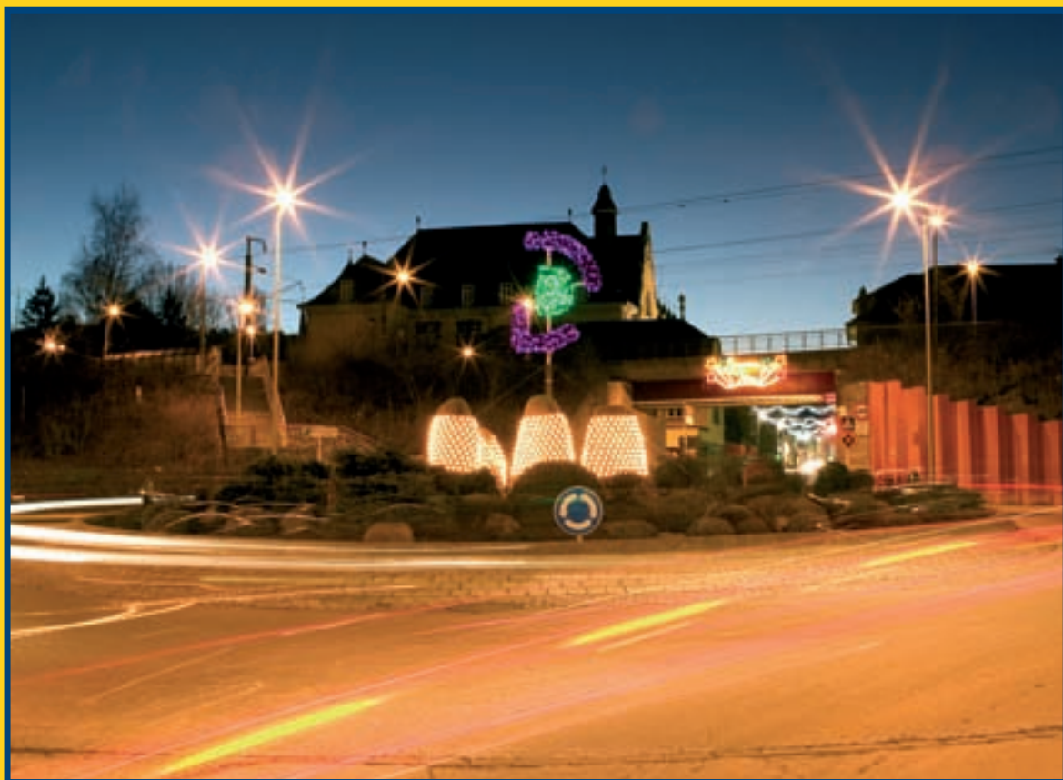
DIFFERDANGE A REVÊTU SES HABITS DE LUMIÈRE POUR ACCUEILLIR DIGNEMENT LA NOUVELLE ANNÉE