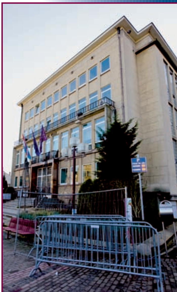
DAS INNERE DES GEMEINDEHAUSES WIRD RENOVIERT UND MODERNISIERT

Änderungen bezüglich der Ausbesserungsprämie für Gebäude und Einrichtungen treten ab dem 1. Januar 2009 in Kraft. Demnach erhalten Personen, welche in die umweltbewusste oder sichere Renovierung ihres Wohnsitzes investieren, von der Gemeinde Differdingen eine Prämie in Höhe von 75% des staatlichen Zuschusses. Ab 2010 wird diese Prämie nur noch bei 50% liegen. Gut für die Umwelt ist auch das neue Trennungssystem unter dem „Parc de la Chiers“. Hier läuft das Abwasser in einen unterirdischen Kollektor, wo es vom sauberen Regenwasser zur optimalen Nutzung getrennt wird. Auch auf dem „Plateau du Funiculaire“ wird künftig ein Auffangbecken dafür sorgen, dass das Regenwasser im Falle eines heftigen Unwetters schnell im Boden versickert, anstatt zu Überschwemmungen zu führen. Anschluss an das Kanalnetz der Gemeinde findet derweil auch die Rue du Rail.