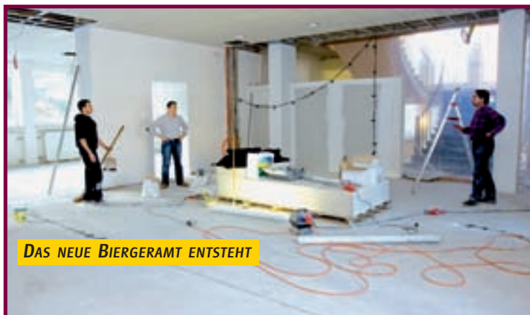
DAS NEUE BIERGERAMT ENTSTEHT

Gemeinsam mit Sudgaz wird sich die Gemeinde im Laufe des neuen Jahres der Weiterführung von Infrastrukturarbeiten der Gasleitungen in den Straßen „rue de Pétange“, „rue Batty Weber“, „rue Edmond Zinnen“ und „rue des Ligures“ annehmen. Von innen saniert wird der alte Differdinger Bahnhof, der, genau wie der Bau und die Instandsetzung von Kinderspielflächen, zu einem attraktiveren Gesamtbild der Gemeinde beitragen wird.