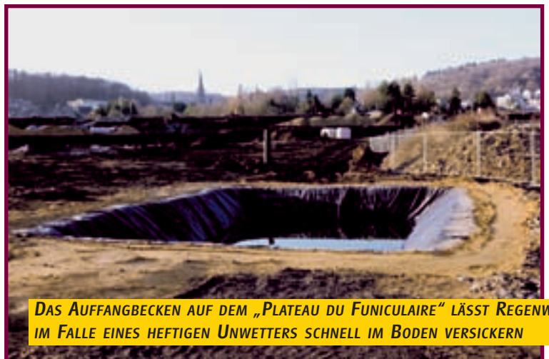
DAS AUFFANGBECKEN AUF DEM „PLATEAU DU FUNICULAIRE“ LÄSST REGENWASSER IM FALLE EINES HEFTIGEN UNWETTERS SCHNELL IM BODEN VERSICKERN

Bessere Bedingungen für Autofahrer wird auch der Parkplatz „Op Gras“ nach seiner Instandsetzung bieten.