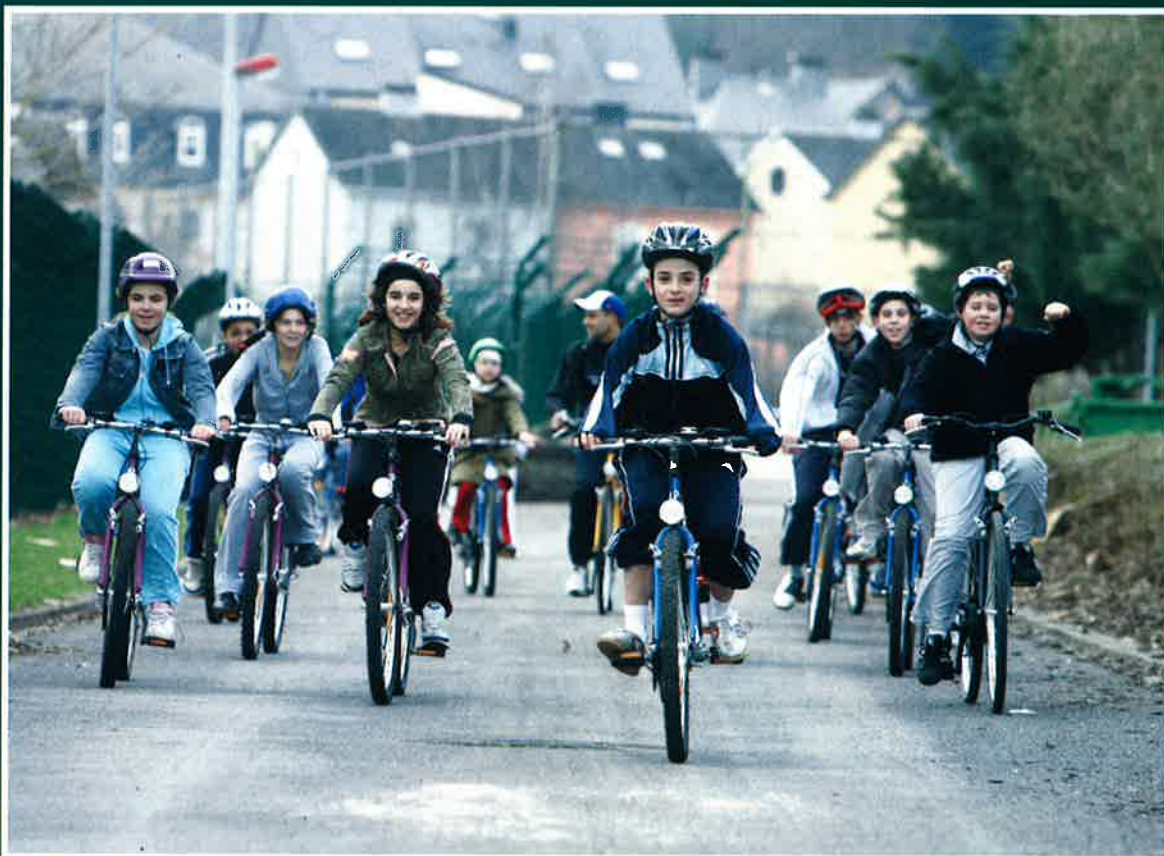
SCHOULSPORTDAG – LES ENFANTS ONT LA PÊCHE!