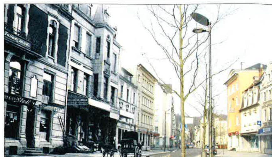
RUE EMILE MARK