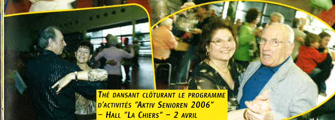
THÉ DANSANT CLÔTURANT LE PROGRAMME D'ACTIVITÉS "AKTIV SENIOREN 2006" - HALL "LA CHIERS" - 2 AVRIL