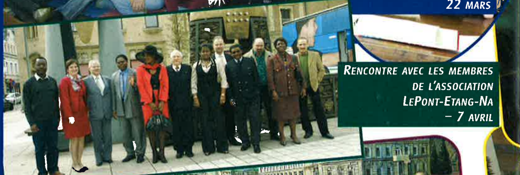
RENCONTRE AVEC LES MEMBRES DE L'ASSOCIATION LEPONT-ÉTANG-NA - 7 AVRIL