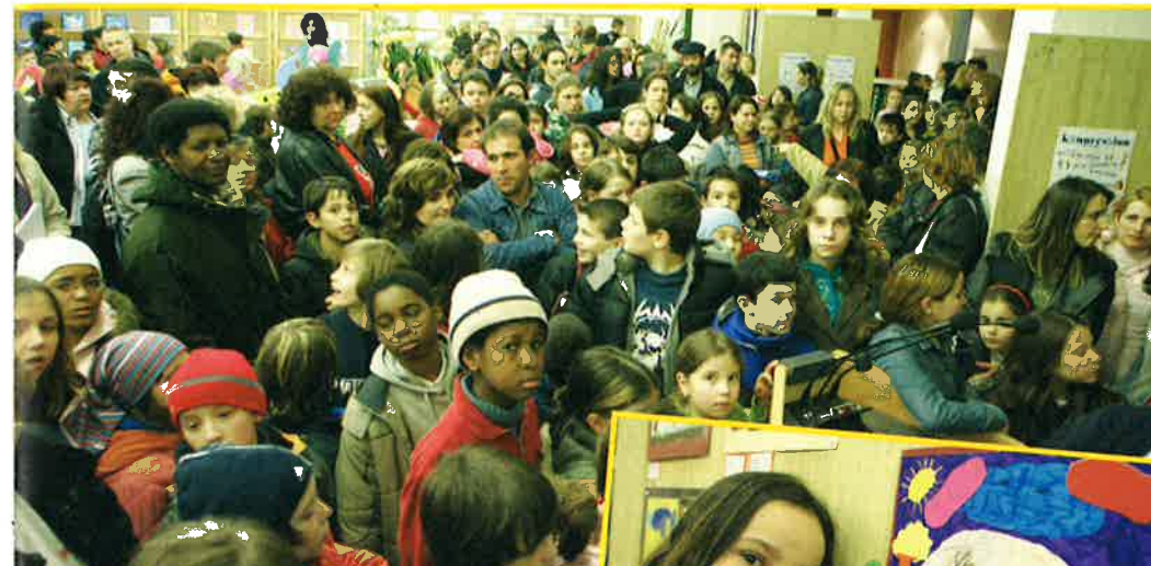
REMISE DES PRIX DE LA 2 E ÉDITION DU KANNERSALON - HALL "LA CHIERS" - 24 MARS