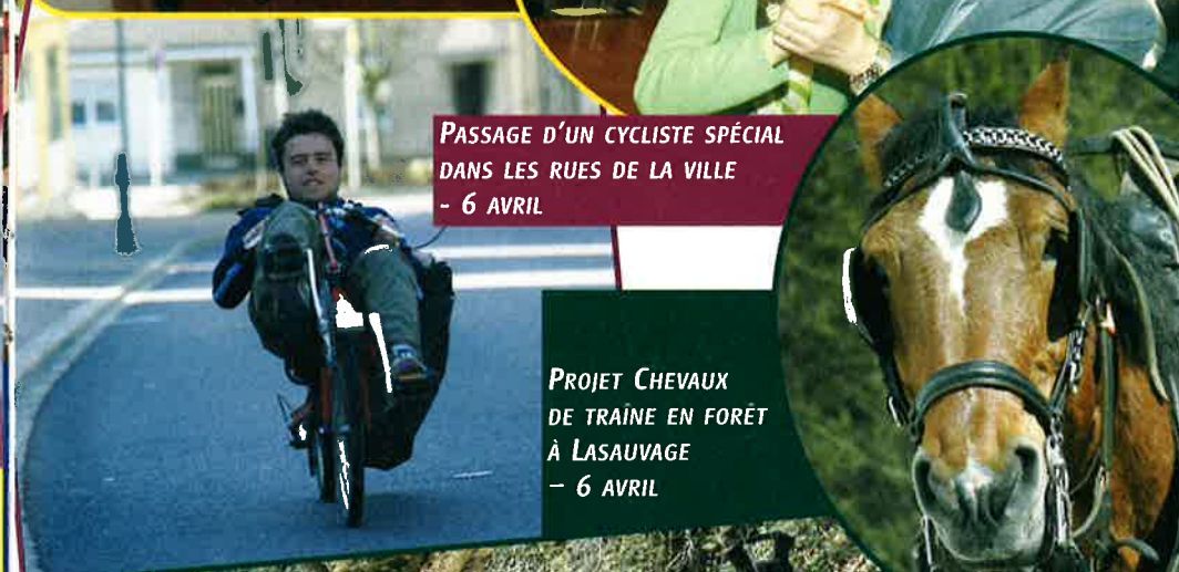
PASSAGE D'UN CYCLISTE SPÉCIAL DANS LES RUES DE LA VILLE - 6 AVRIL