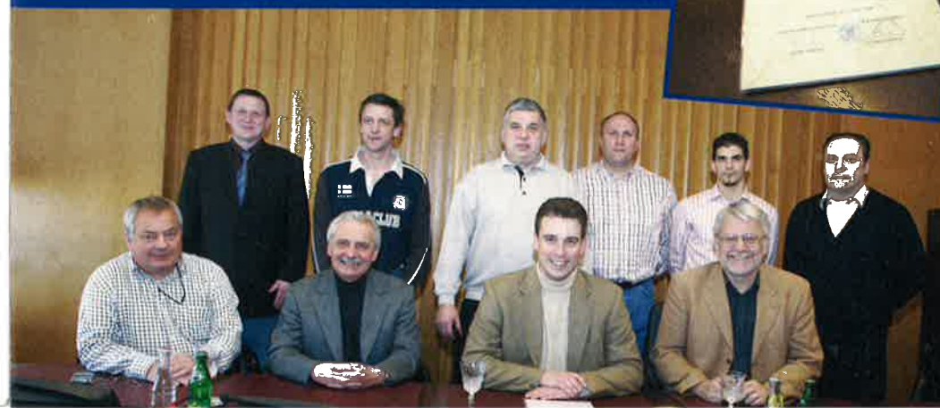
REMISE DE LA MÉDAILLE D'HONNEUR "ARMOIRIES DE DIFFERDANGE" PAR LA VILLE DE DIFFERDANGE À LA SOCIÉTÉ GYMNIQUE LA LIBERTÉ NIEDERKORN DANS LE CADRE DE SON CENTENAIRE