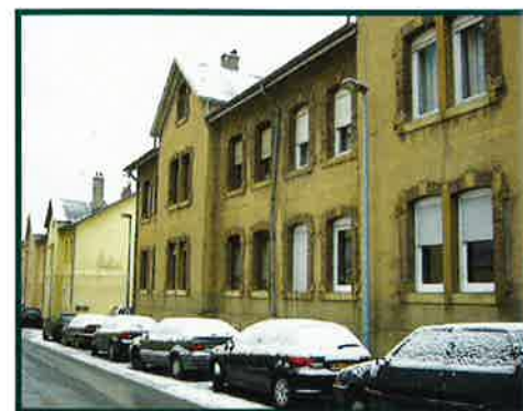
RUE DE L'ACIER

Um eine bessere Lieferung der Hütte mit Koks zu gewährleisten, fand 1899 die Fusion mit der Kohlengrube „Dannenbaum“ in Bochum statt. Die neue Gesellschaft nannte sich nun „Aktien-gesellschaft für Eisen- und Kohlenindustrie Differdingen-Dannenbaum“. Die Firma begann sofort mit der Planung einer größeren Siedlung. Da inzwischen die Bodenpreise in der Nähe der Schmelz stark angezogen hatten, erwarb das Unternehmen ein größeres Areal in den Oberkornen Wiesen. Hier baute sie die „ Kolonie Dannenbaum “ in ähnlicher Bauweise wie die Kolonie in der Stahlstraße. Die neue „Deutsch-Luxemburgische Bergwerks- und Hütten A.G.“ baute 1901 weiter in Oberkorn eine Siedlung von 4 Straßen mit Doppelhäusern, Einfamilienhäusern und Drei- bis Vierfamilienhäusern. Wohnkomfort und Größe hingen von der Stellung des Bewohners im Betrieb ab. Die Größe der Wohnung variierte zwischen 44 und 90 qm. Die Arbeiterfamilien lebten auf engsten Wohnverhältnissen und ihre Arbeit verfolgte sie bis in ihre Privatsphäre. Dadurch dass der Mietvertrag an den Arbeitsvertrag gekoppelt war und gewisse Be-