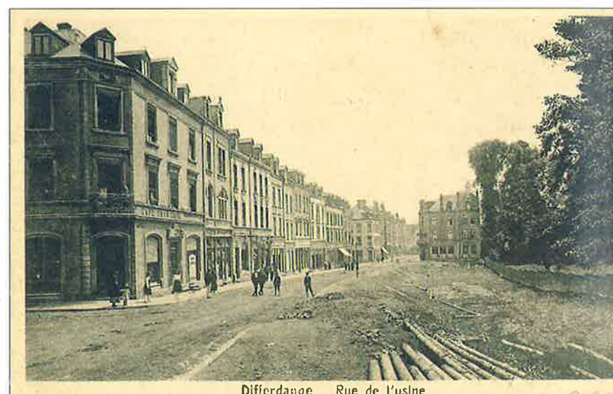
Differdange Rue de l'usine