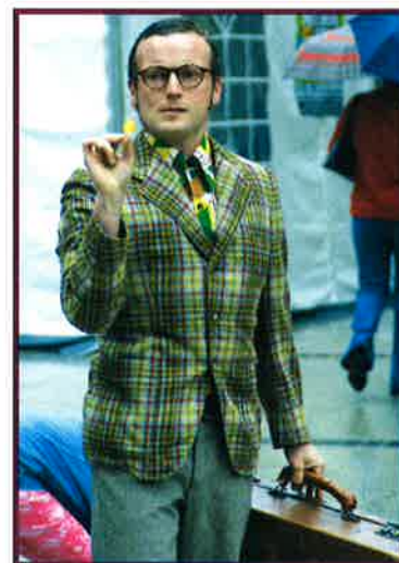
ANIMATIONS DE RUE...

En 2004, la Commune de Differdange organisa une grande fête populaire afin de marquer la récente inauguration de la zone piétonne et, plus généralement, le nouveau souffle du centre-ville. Mélangeant des concerts de musique, des animations de rue et toute une panoplie de stands gastronomiques, le STREETFESTIVAL connut un succès populaire indéniable. Les responsables communaux décidèrent donc de reconduire l'événement en 2005 – à nouveau la fête rencontra les faveurs du grand public.