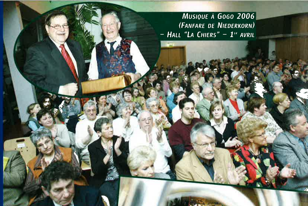
MUSIQUE À GOGO 2006 (FANFARE DE NIEDERKORN) - HALL "LA CHIERS" - 1 er AVRIL

Streetfestival Zone piétonne à Differdange Ouverture officielle: vendredi, 18h00 Vendredi, de 19h00-1h00 Samedi, de 15h00-21h00 Org.: Comité des Fêtes de la Ville de Differdange