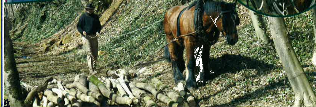
PROJET CHEVAUX DE TRAÎNE EN FORÊT À LASAUVAGE - 6 AVRIL