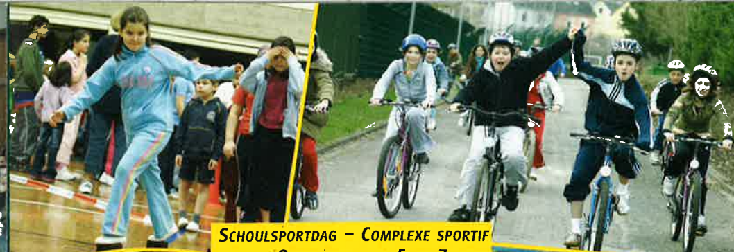
SCHOULSPORTDAG - COMPLEXE SPORTIF OBERKORN - DU 5 AU 7 AVRIL