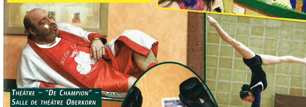
THÉÂTRE - "DE CHAMPION" - SALLE DE THÉÂTRE OBERKORN