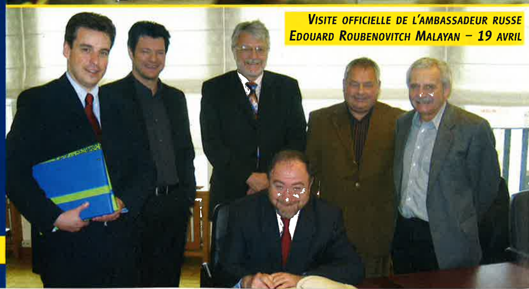
VISITE OFFICIELLE DE L'AMBASSADEUR RUSSE EDOUARD ROUBENOVITCH MALAYAN - 19 AVRIL