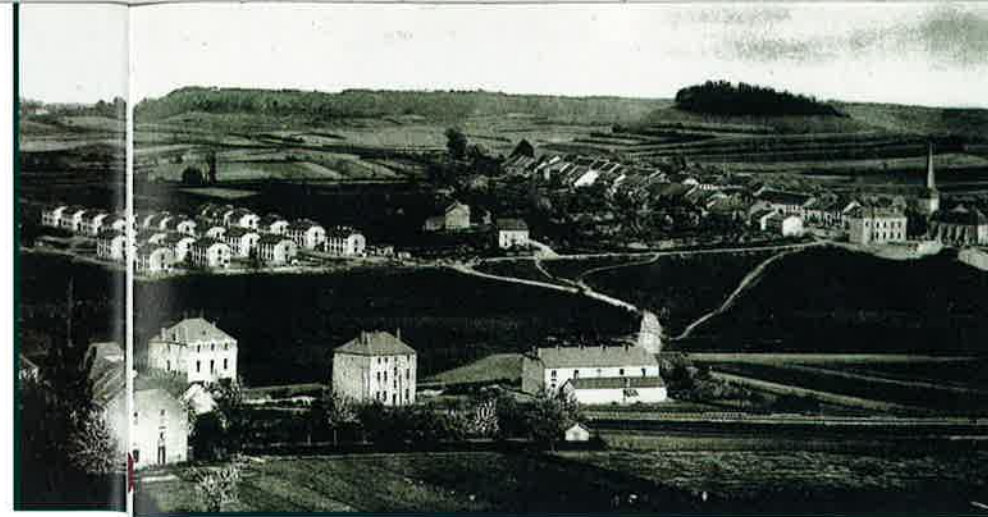
KOLONIEN IN OBERKORN

dingungen bezüglich des Verhaltens auf der Arbeitsstelle gestellt wurden, blieben die Bewohner in hohem Maße abhängig vom Wohlwollen des Arbeitgebers. So gar die Straßennamen erinnerten an die Schmelz: „ rue de l'Industrie, de la Sidérurgie, de la Métallurgie, du Travail “.