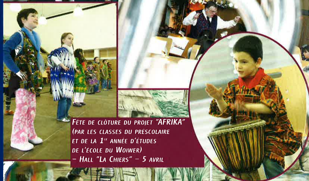
FÊTE DE CLÔTURE DU PROJET "AFRIKA" (PAR LES CLASSES DU PRÉSCOLAIRE ET DE LA 1 re ANNÉE D'ÉTUDES DE L'ÉCOLE DU WOIER) - HALL "LA CHIERS" - 5 AVRIL