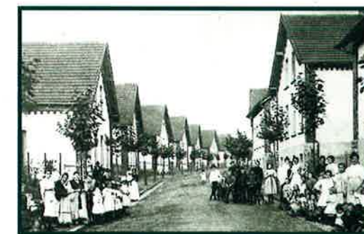
RUE DU FUNICULAIRE

toinette Lorang: Luxemburgs Arbeiterkolonien und Billige Wohnungen). Der Mietsvertrag war wie gesagt an den Arbeitsvertrag gekoppelt. Es gab keinen Mieterschutz für den Bewohner. Bei der Pensionierung musste die Familie ausziehen. Verstarb der Arbeiter, so wurde seiner Familie ebenfalls gekündigt. Leider wurde nach dem Verkauf dieser Häuser durch