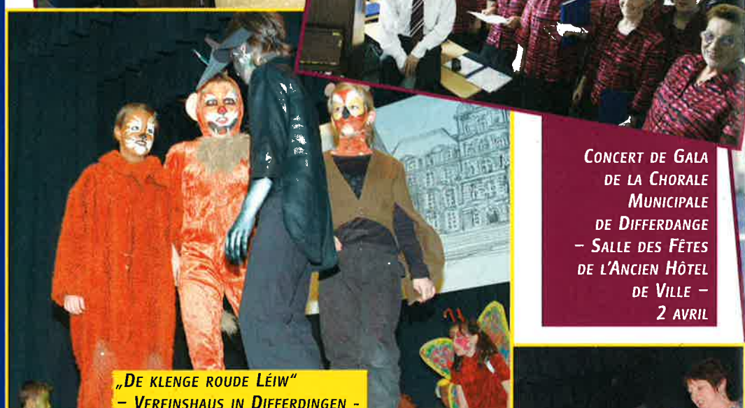
"DE KLENGE ROUDE LÉIW" - VEREINSHAUS IN DIFFERDINGEN - AM 6, 7, 8 UND 9 APRIL