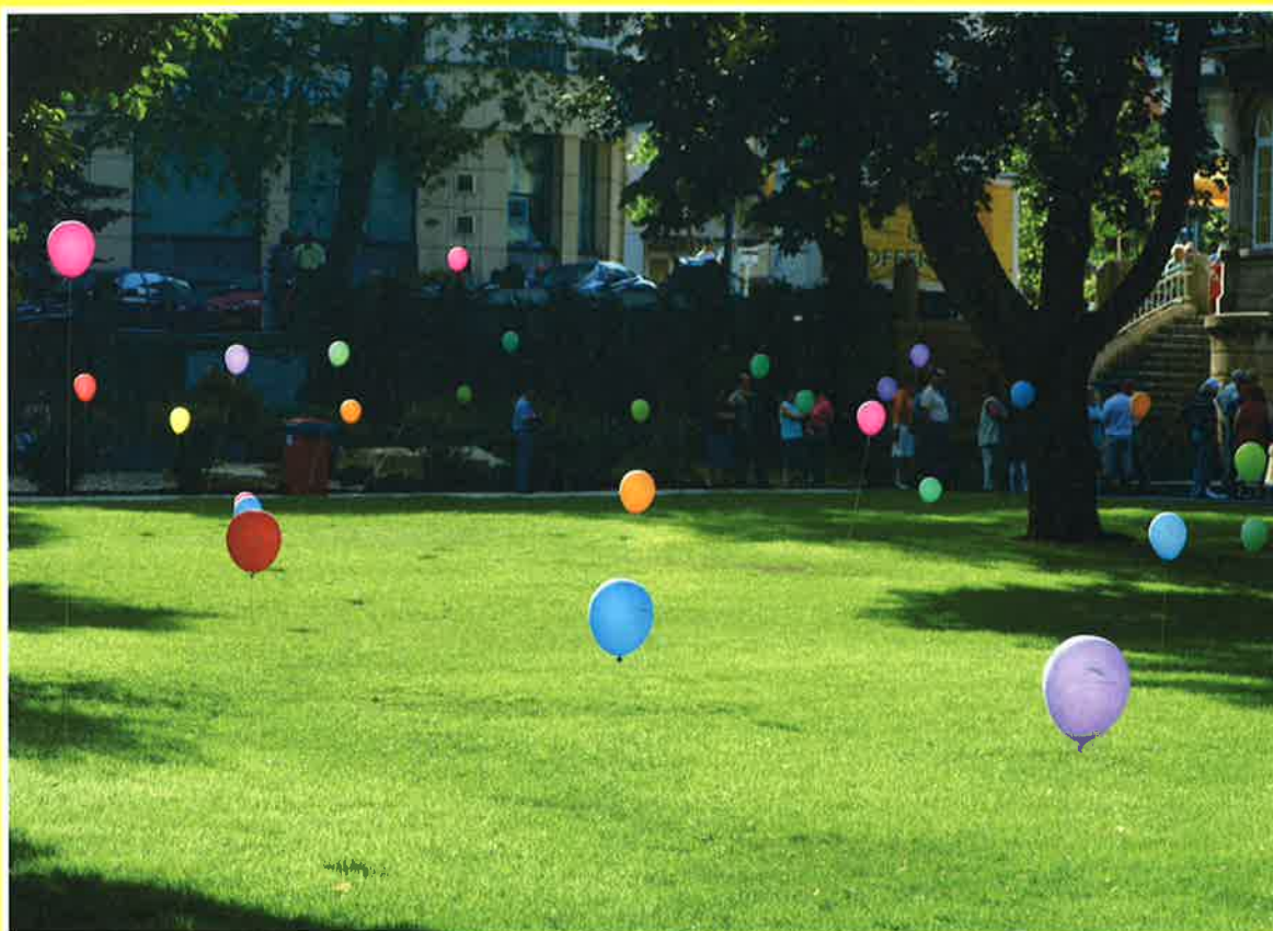
INAUGURATION LE 28 JUILLET DU NOUVEAU PARC GERLACHE

Interviews: que pensez-vous du nouveau parc Gerlache?