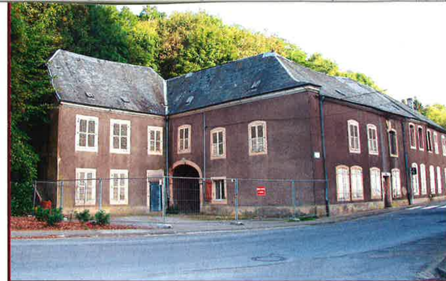
Château de Saintignon