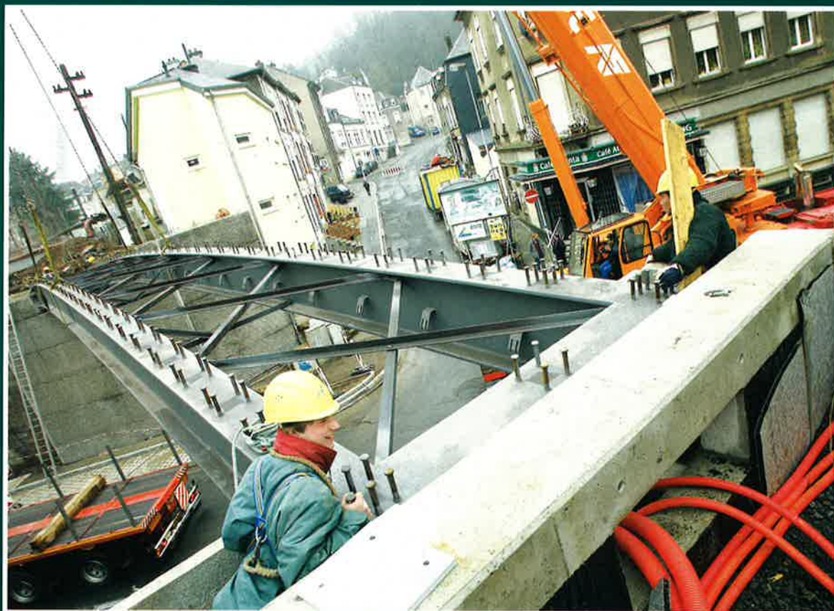
MISE EN PLACE DU NOUVEAU PONT DANS L'AVENUE DE LA LIBERTÉ

Les modifications du Plan d'aménagement général