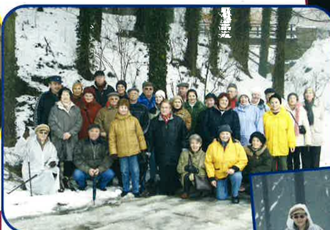
WANTERTRÉPELTOUR POUR SENIORS - 8 MARS