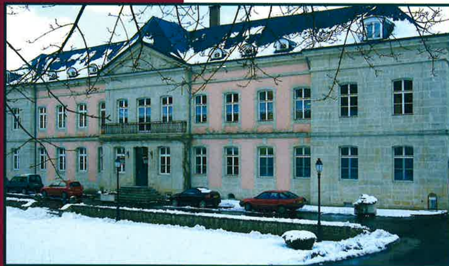
DAS FRÜHERE FRAUENKLOSTER