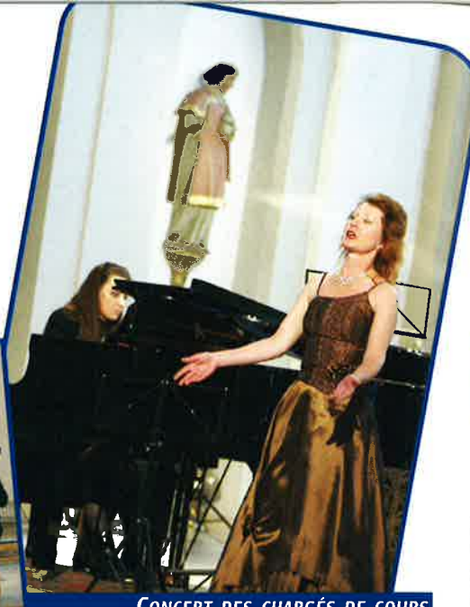
CONCERT DES CHARGÉS DE COURS DE L'ÉCOLE DE MUSIQUE - ÉGLISE D'OVERKORN - 12 MARS