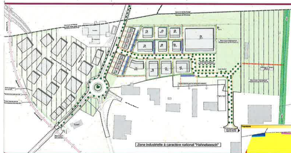
DÉVELOPPEMENT DE LA ZONE D'ACTIVITÉS RÉGIONALES „HAHNEBOESCH“

les points de réclamation, sera soumis à un 2e vote du Conseil communal. Après cette deuxième lecture, et après une nouvelle période de publication de 15 jours, les modifications du PAG seront transmises au ministre de l'Intérieur pour approbation. Une fois cette étape de la procédure franchie, le PAG modifié constituera un cadre urbanistique légal sur lequel devront se calquer tous les PAP.