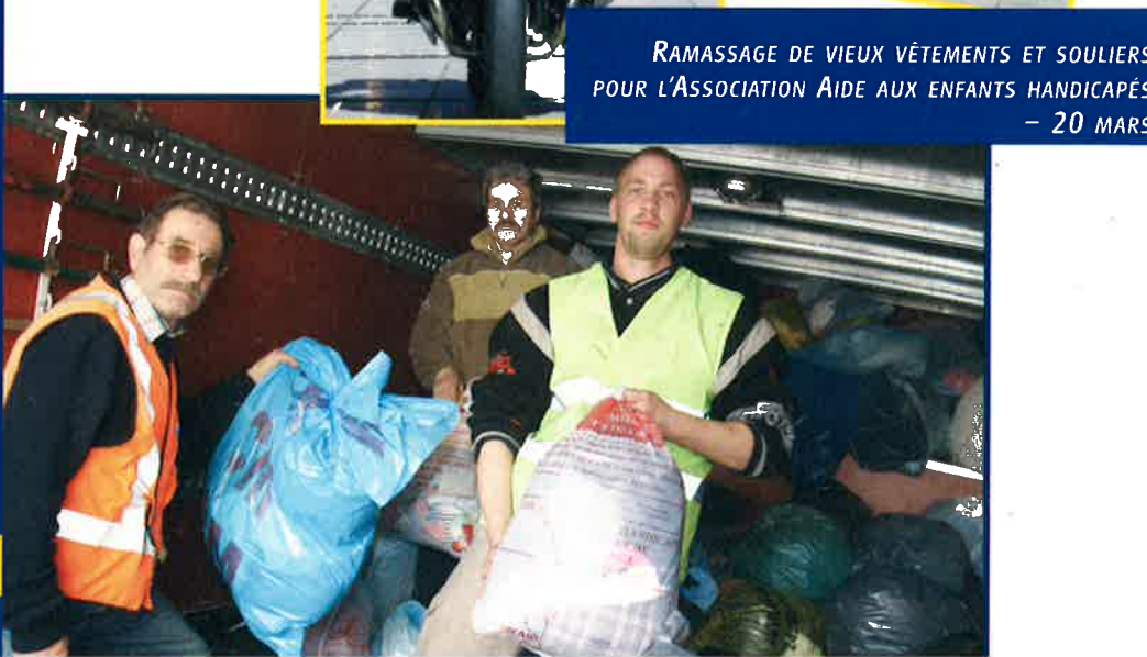
RAMASSAGE DE VIEUX VÊTEMENTS ET SOULIERS POUR L'ASSOCIATION AIDE AUX ENFANTS HANDICAPÉS - 20 MARS