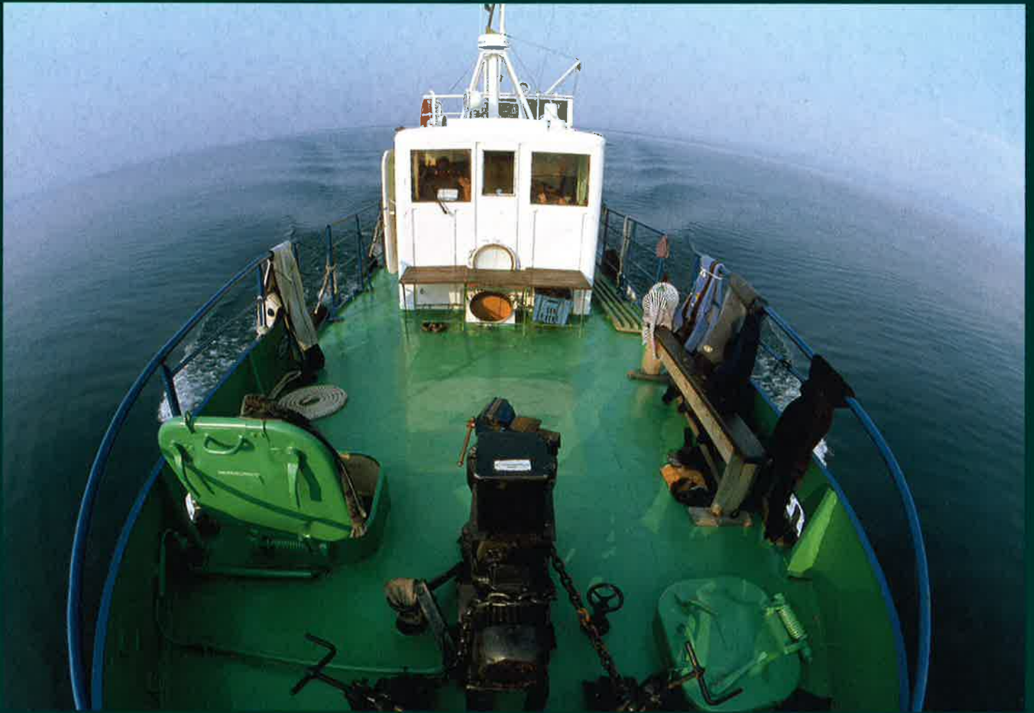
Kultur am Fréijoer: Diashow „Baikal – La perle de Sibérie“, le 12 mai, 20h00, Centre Noppeney