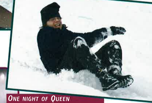
ONE NIGHT OF QUEEN - 12 MARS - CENTRE SPORTIF OBERKORN