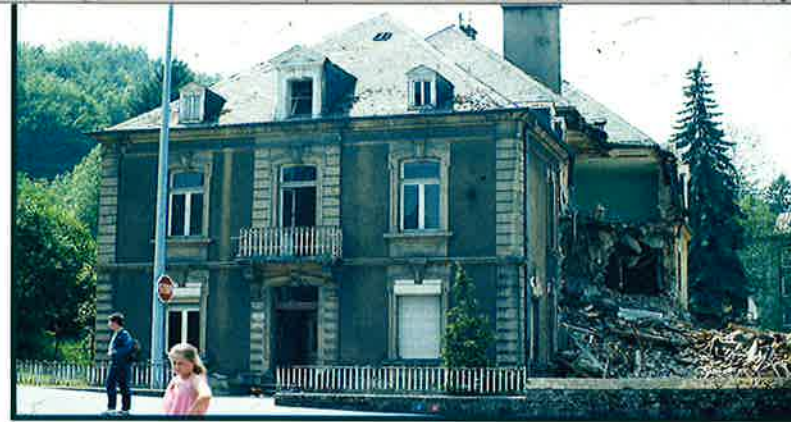
DAS ALTE SPITAL WURDE IM JAHRE 1984 ABGERISSEN

Im Jahre 1971 trat die Arbed ihr Spital in Niederkorn an die Gemeindeverwaltung ab. Von nun an war es eine Annexe des Differdinger Spitals. Die Barmherzigen Brüder verließen das Spital im Jahre 1973. Bis Juni 1978 funktionierte es noch als Krankenhaus. Ab Januar 1979 war es nur noch Pflegeheim und zwar bis zu dem Moment als der Staat das Spital in Differdingen erworben und dort ein Pflegeheim eingerichtet hatte. Im Jahre 1984, als das neue Niederkorner interkommunale Spital bereits funktionierte, wurde das alte abgerissen, um einer breiten