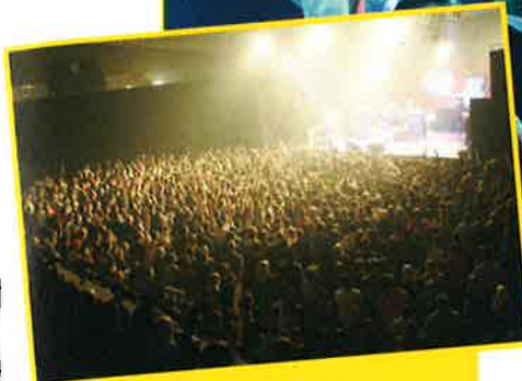
CONCERT DU GROUPE BLOODHOUND GANG - 4 MARS - CENTRE SPORTIF OBERKORN