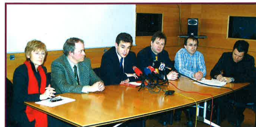
LES MEMBRES DU COMITÉ DU SYNDICAT INTERCOMMUNAL DE L'HPMA