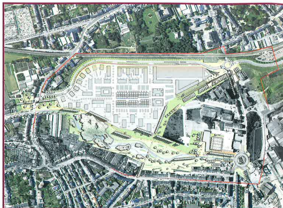
LE PLATEAU FUNICULAIRE: UN GRAND PROJET À L'HORIZON

Le jeudi 16 mars, quelque 50 citoyens ont assisté à une séance publique d'information sur les modifications ponctuelles du Plan d'aménagement général (PAG), approuvées provisoirement par le Conseil communal en date du 22 février dernier, sur base de l'avis préalable de la Commission d'aménagement.