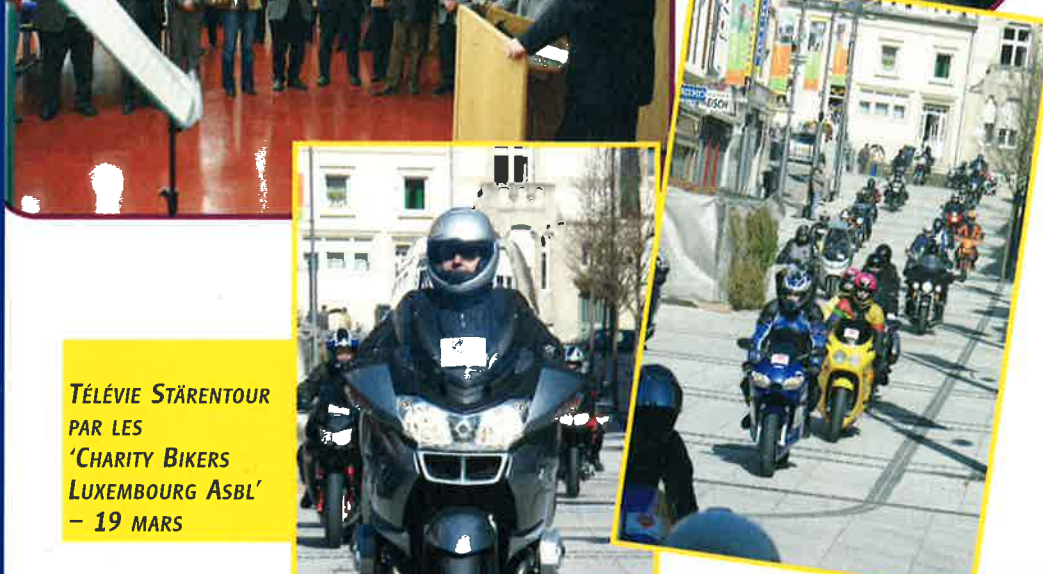
TÉLÉVIE STÄRENTOUR PAR LES 'CHARITY BIKERS LUXEMBOURG ASBL' - 19 MARS