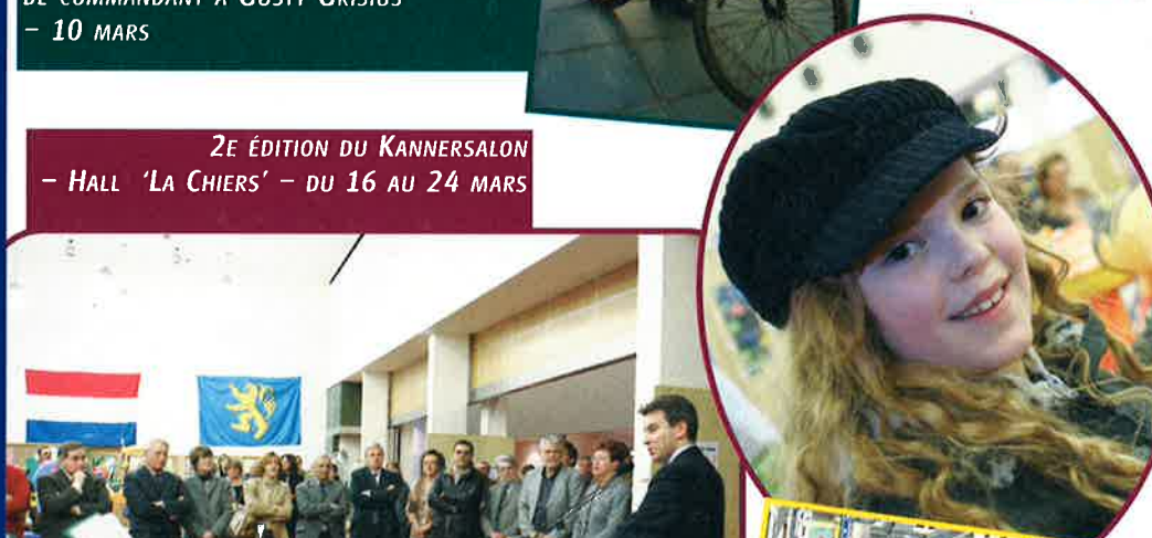
2 E ÉDITION DU KANNERSALON - HALL 'LA CHIERS' - DU 16 AU 24 MARS