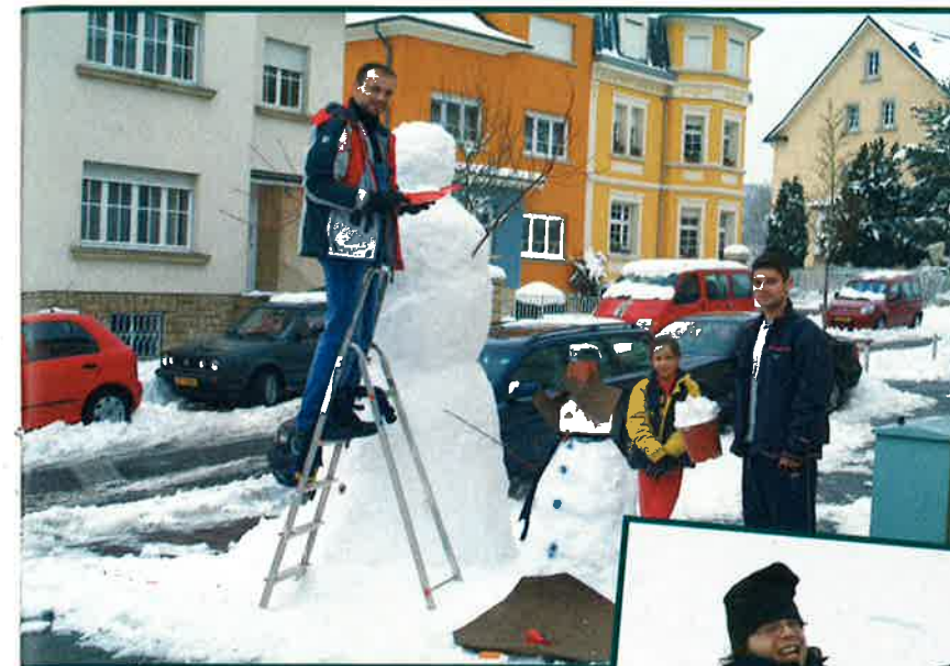
DIFFERDANGE TRANSFORMÉE EN STATION D'HIVER !!!