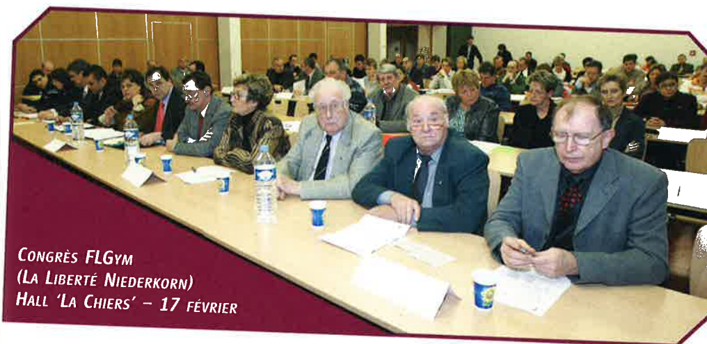
CONGRÈS FLGYM (LA LIBERTÉ NIEDERKORN) HALL 'LA CHIERS' – 17 FÉVRIER