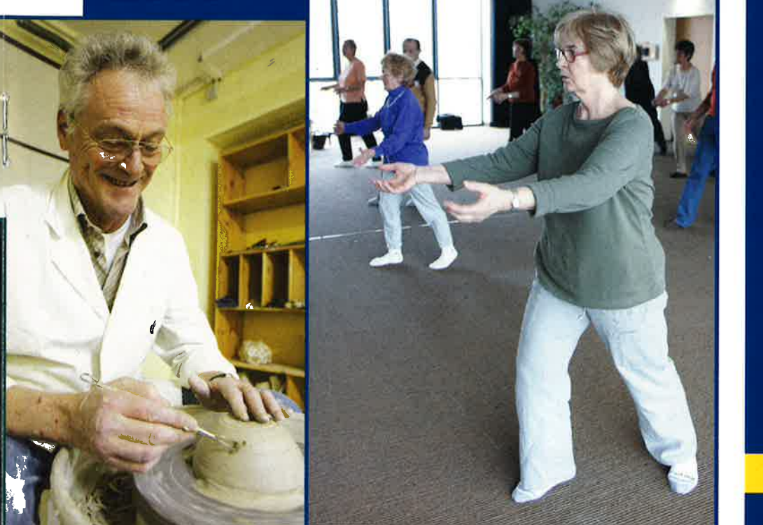
ACTIVITÉS SENIORS 2006 POTERIE ET TAI-CHI