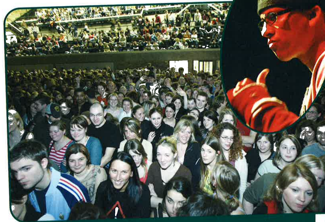
CONCERT DE XAVIER NAIDOO – CENTRE SPORTIF OBERKORN – 7 FÉVRIER