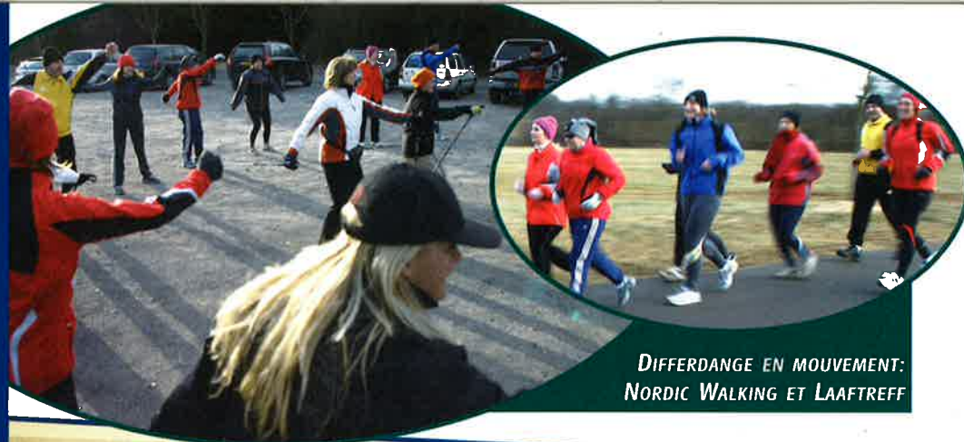
DIFFERDANGE EN MOUVEMENT: NORDIC WALKING ET LAAFTREFF

Hot Chili Party Café Maxims à Oberkorn - 21h00 Org. JDL-Déifferdeng