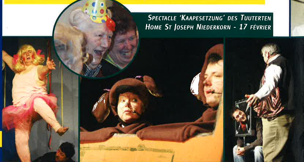
SPECTACLE 'KAAPESZTUNG' DES TUUTERTEN HOME ST JOSEPH NIEDERKORN – 17 FÉVRIER