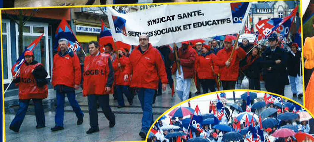
MANIFESTATION DES EMPLOYÉS DE L'HÔPITAL – 16 FÉVRIER À L'APPEL DU SYNDICAT OGB-L, QUELQUE 300 MEMBRES DU PERSONNEL DE L'HÔPITAL PRINCESSE MARIE-ASTRID ONT DÉFILÉ LE 16 FÉVRIER À TRAVERS LES RUES DE DIFFERDANGE. LES MANIFESTANTS ONT REVENDIQUÉ L'ÉTABLISSEMENT D'UN BUDGET RÉALISTE QUI NE METTE EN QUESTION NI LES EMPLOIS ACTUELS NI LA QUALITÉ DES SOINS AUX PATIENTS