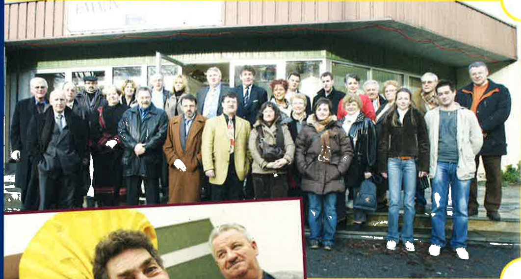
VISITE DU 'COMITÉ DES FÊTES DE LA VILLE DE DIFFERDANGE' À LA VILLE DE LONGWY (VILLE JUMELÉE AVEC DIFFERDANGE) - 21 JANVIER