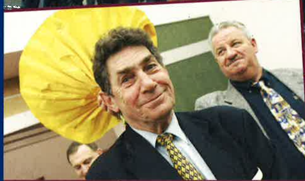
OVATION DES MEMBRES DU NOUVEAU CONSEIL COMMUNAL HALL 'LA CHIERS' 15 FÉVRIER