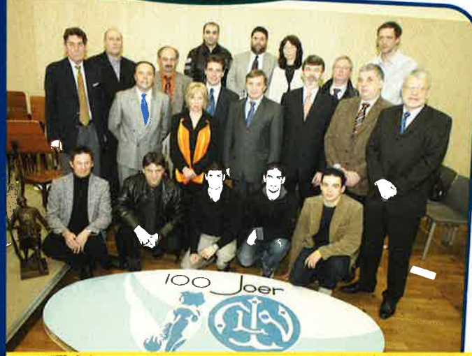
SÉANCE ACADÉMIQUE LA LIBERTÉ NIEDERKORN SALLE DE MUSIQUE NIEDERKORN - 12 FÉVRIER