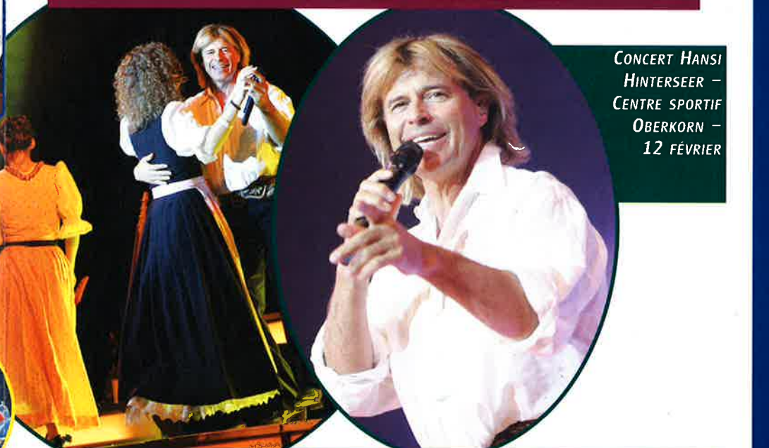
CONCERT HANSI HINTERSEER – CENTRE SPORTIF OBERKORN – 12 FÉVRIER