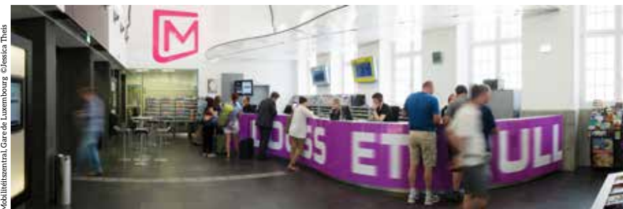
Mobilitétszentral, Gare de Luxembourg

Après avoir payé la caution de 20€, vous recevrez votre mKaart contenant la clé d'accès par voie postale.