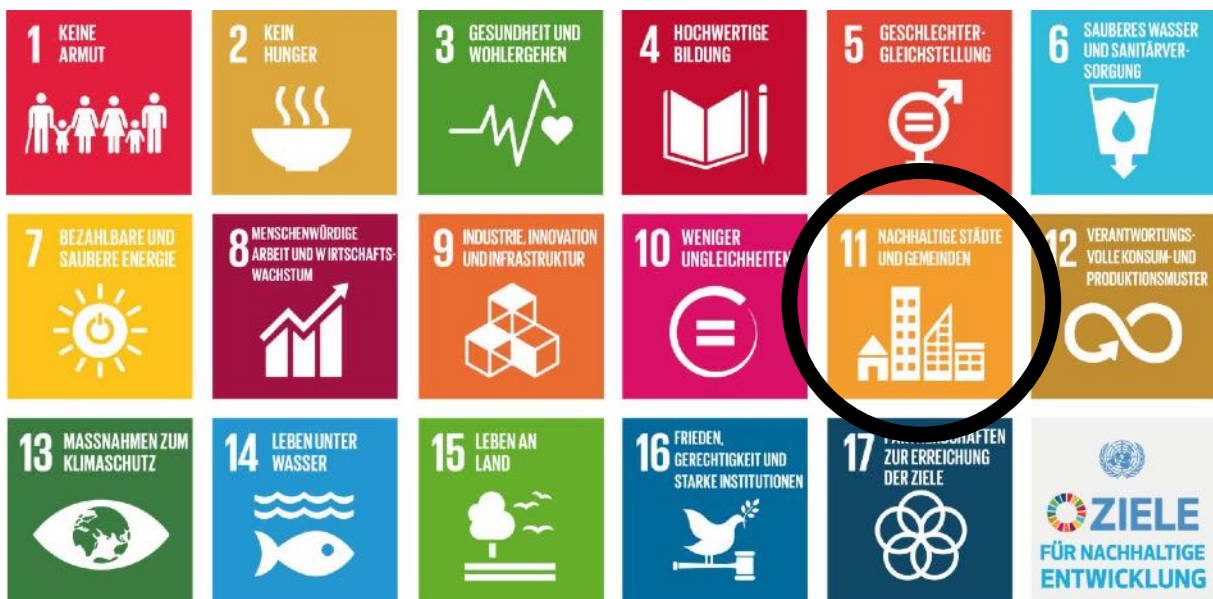
Abbildung 1: Grafische Darstellung der 17 Ziele nachhaltiger Entwicklung der Vereinten Nationen - Icons in deutscher Sprache

Der Begriff der Nachhaltigkeit wurde 1987 im Brundtland-Bericht der Vereinten Nationen wie folgt definiert: „Nachhaltig ist eine Entwicklung, die den Bedürfnissen der heutigen Generation entspricht, ohne die Möglichkeiten künftiger Generationen zu gefährden, ihre eigenen Bedürfnisse zu befriedigen und ihren Lebensstil zu wählen.“ Die Vorgehensweise entwickelte sich aus der Erkenntnis, dass ein ökologisches Gleichgewicht nur unter gleichberechtigtem Einbezug ökonomischer Sicherheit und sozialer Gerechtigkeit erfolgen kann.