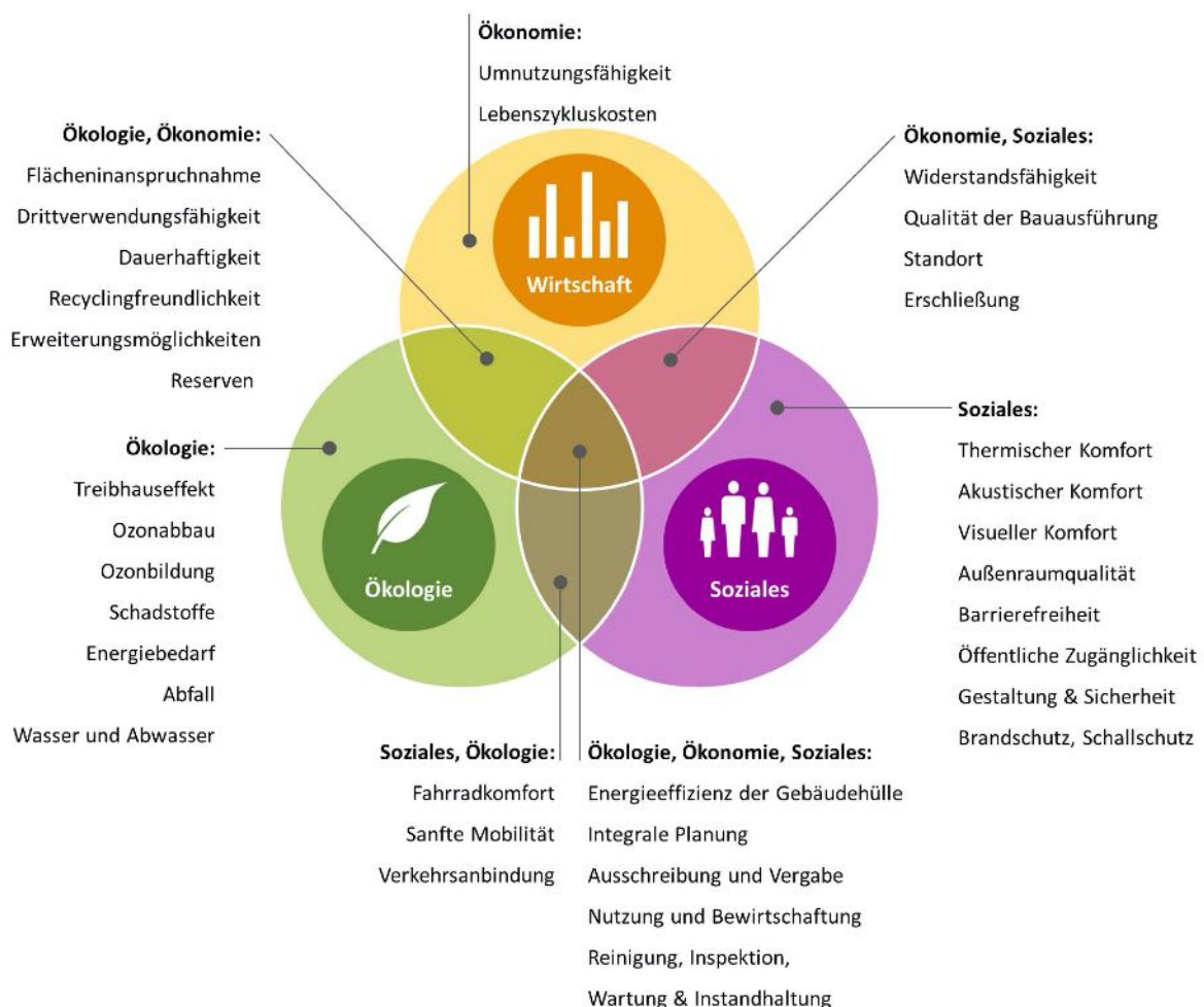
Abbildung 2: Grafik - Qualitätsanforderungen nach Zusammengehörigkeit in den Bereichen: Wirtschaft, Umwelt & Gesellschaft

Neben Merkmalen und Eigenschaften des Gebäudes, die sich auf die Ökologie, die Ökonomie sowie auf soziokulturelle und funktionale Schutzziele auswirken, sind technische Eigenschaften sowie Aspekte der Planung und Ausführung bei Gebäuden qualitätsbestimmend.