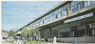
1535* Creative Hub

La centrale électrique de la société Paul Wurth construite en 1913 à Luxembourg provisionne à l'époque les différents ateliers en courant alternatif et en courant continu. Le hall a des caractéristiques architecturales de l'époque : ossature métallique en treillis avec maçonnerie en brique, des longs pans