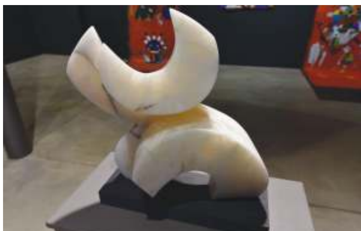
Tom Flick : «Last Titan»