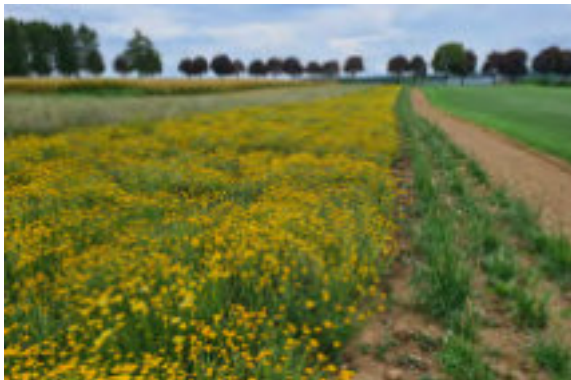
E Feld vum Wëllplanzesom Lëtzebuerg fir d'Produktioun vu Geseems. Dës gëtt duerno an d'LUX-Mëschungen ageschafft.

Jiderengem, deen eng Blummewiss bei sech doheem am Gaart oder op ëffentleche Gréngflächen uleeë wëll, recommandéiere mir d'LUX-Mëschung vum Wëllplanzesom Lëtzebuerg . Dës Mëschungen enthalten nëmmen Aarten, déi zu Lëtzebuerg natierlech virkommen a wichteg Fudderplanze fir eis heemesch Päiperleken an aner Insekten sinn.