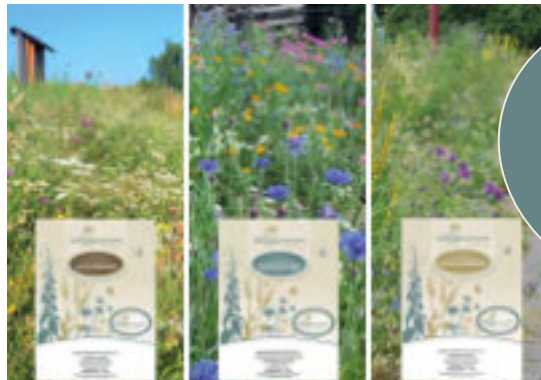
Déi dräi Mëschungen fir de Siidlungsraum. D'Qualitéit gëtt duerch eng Zerifizéierung séchergestallt.

Kommt Iech en Echantillon vun enger LUX- Mëschung an de Guichet vun Ärer Gemengsichen!