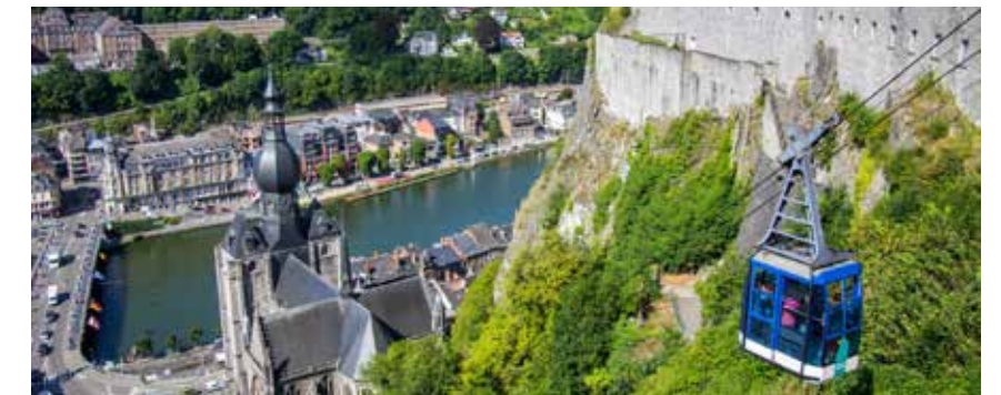
Citadelle de Dinant

Découvrez le fabuleux voyage d'un des plus grands artistes du XX e siècle, à l'origine des célèbres Tintin et Milou, deux personnages de bande dessinée qui ont vu le jour en 1929. Le musée réunit plus de 80 planches originales, 800 photos, des documents et divers objets du dessinateur célèbre.