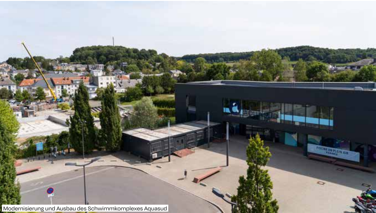
Modernisierung und Ausbau des Schwimmkomplexes Aquasud

Das Pilotprojekt Pedibus in Oberkorn wird auf weitere Stadtteile ausgeweitet.