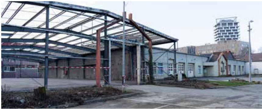
Un second parking au Haneboesch

La Ville de Differdange annonce la création de deux nouveaux espaces de stationnement destinés à améliorer la situation du parking dans la commune.