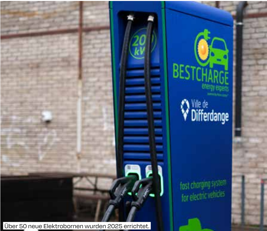
Über 50 neue Elektroböden wurden 2025 errichtet.

Gemeinsam mit Sicona werden bestehende Biotope erhalten und neue geschaffen. Ein Gemeinschaftsgarten im Stadtzentrum ist ebenfalls in Planung.