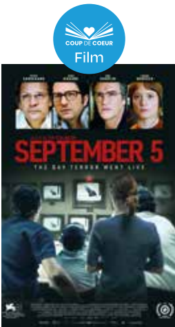
September 5 Tim Fehlbaum

Die Geschichte handelt von Ally, die in der Schule Probleme beim Lesen hat und das aus Scham versteckt. Mit Unterstützung eines neuen Lehrers erkennt sie, dass sie Legasthenie hat und einfach anders lernt. Sie findet langsam Mut und Selbstvertrauen – und merkt, dass jeder Stärken hat, auch wenn sie nicht sofort sichtbar sind.