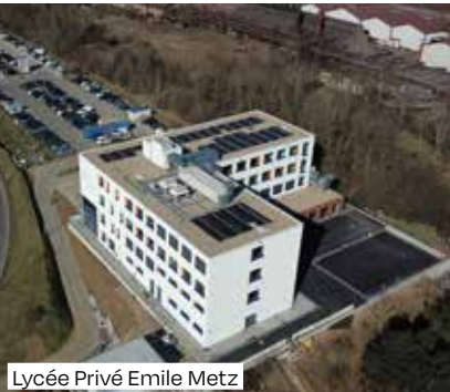
Lycée Privé Emile Metz

Ein weiterer Schwerpunkt liegt auf der allgemeinen Barrierefreiheit. Die Stadt