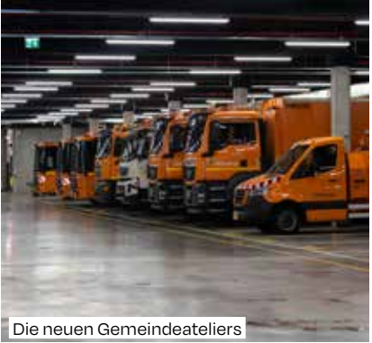
Die neuen Gemeindeateliers

Die Sportuniversität Lunex plant Kapazitäten für 1500 Studierende, das Lycée Privé Emile Metz einen definitiven