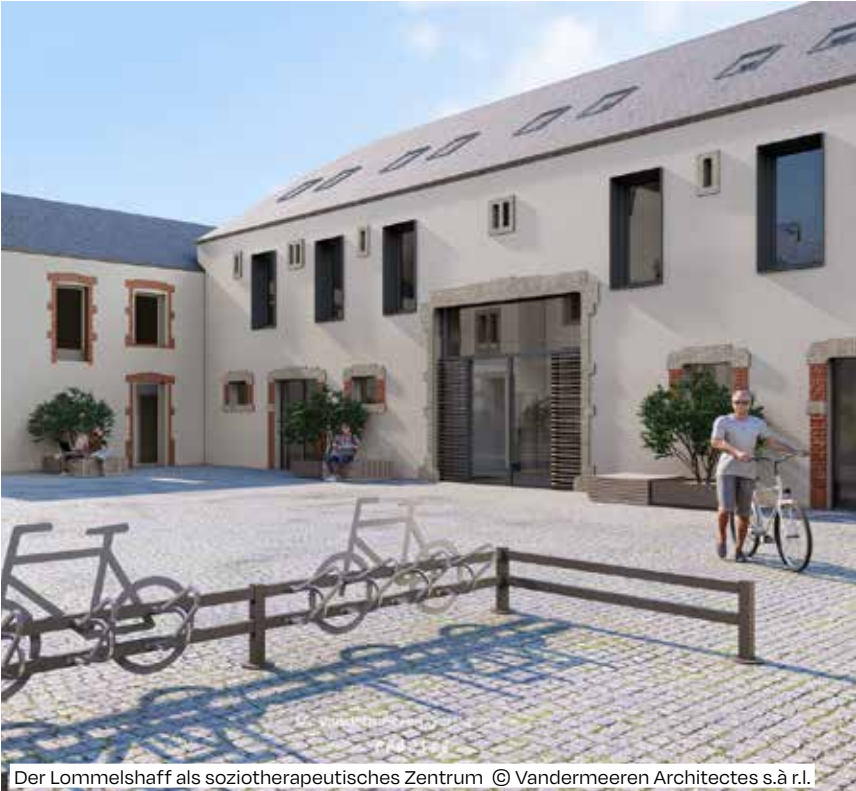
Der Lommelshaff als soziotherapeutisches Zentrum