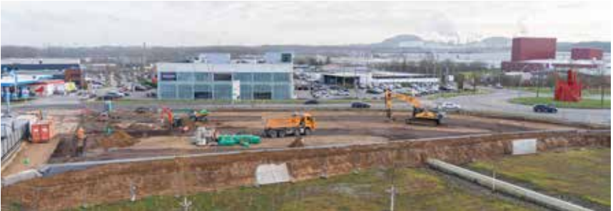
Parking au Haneboesch

rues avoisinantes pour les habitants du quartier », souligne Tom Ulveling, premier échevin de Differdange. Les résidents pourront ainsi plus facilement trouver des emplacements près de chez eux, une fois que les personnes travaillant dans le secteur utiliseront le nouveau parking.