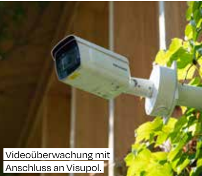
Videoüberwachung mit Anschluss an Visupol.

plant Infrastrukturen im Einklang mit dem Gesetz zur Zugänglichkeit von öffentlichen Orten. Ferner wird die Internetseite angepasst, um besseren Zugang zu Informationen und Dienstleistungen zu gewährleisten, u. a. mit einem automatisierten Übersetzungstool.