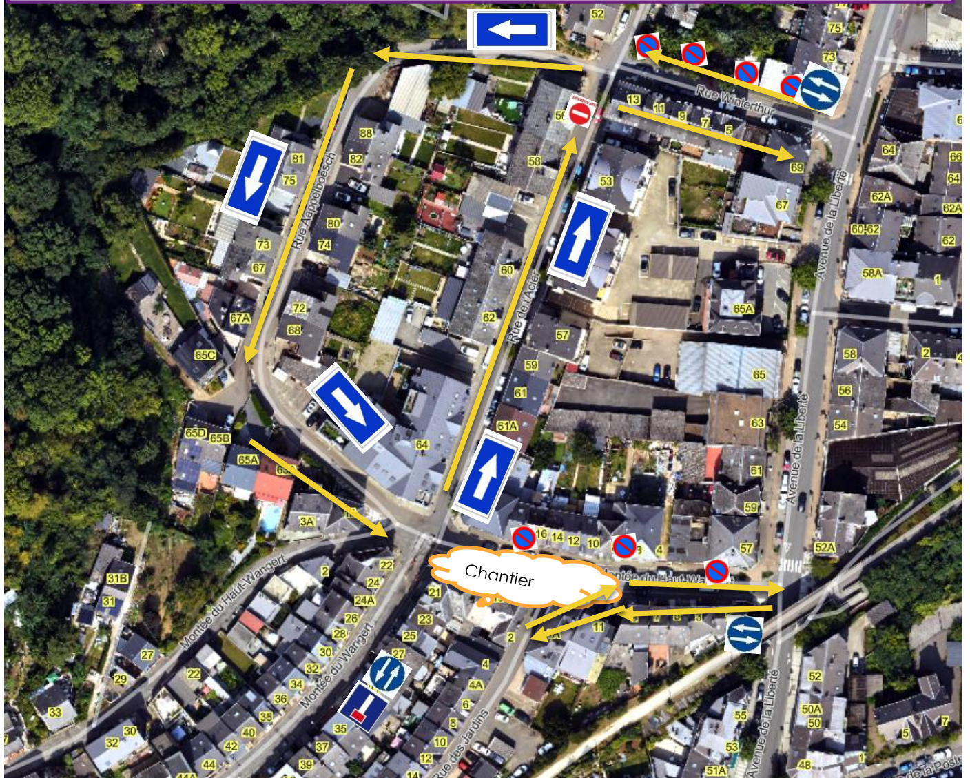
Plan de circulation provisoire