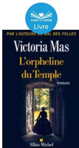
L'Orpheline du temple Victoria Mas

Ce mois-ci, la bibliothèque vous propose de découvrir: