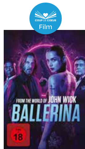
Balarina John Wick

Ballerina folgt der jungen Auftragskillerin Rooney, die nach dem Mord an ihrer Familie gnadenlos Rache sucht und dabei in die tödliche Unterwelt gerät, die man bereits aus den John Wick -Filmen kennt. Auf ihrem blutigen Weg kreuzen sich Loyalitäten, Geheimnisse und hochstilisierte Action, die das Universum um eine neue, ebenso elegante wie erbarmungslose Kämpferin erweitert.