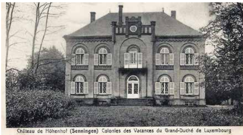
Château de Höhenhof (Senningen) Colonies des Vacances du Grand-Duché de Luxembourg