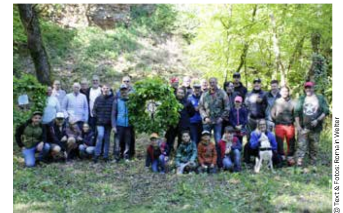
© Text & Fotos: Romain Welter