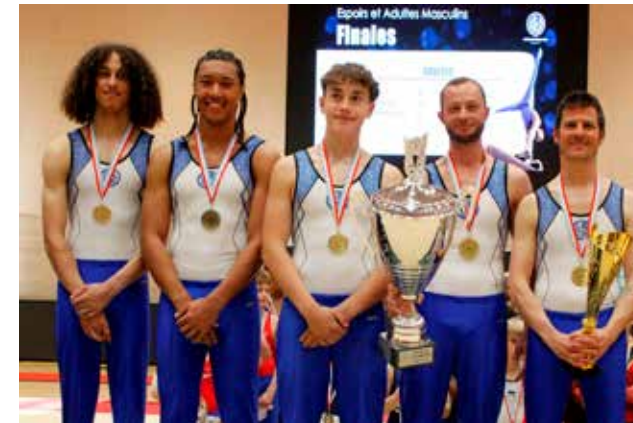
© Text & Fotos: Romain Welter